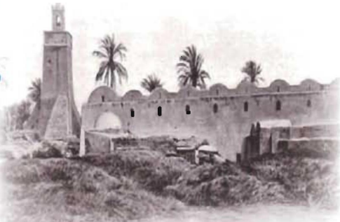
جامع مراد آغا قبل سقوط المندنة القديمة