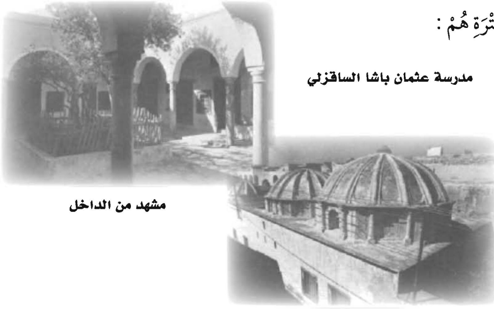
مشهد من الداخل

وَكَانَ أَهْمُ الْوَلَاةِ فِي تِلْكَ الْفَتْرَةِ هُمْ :