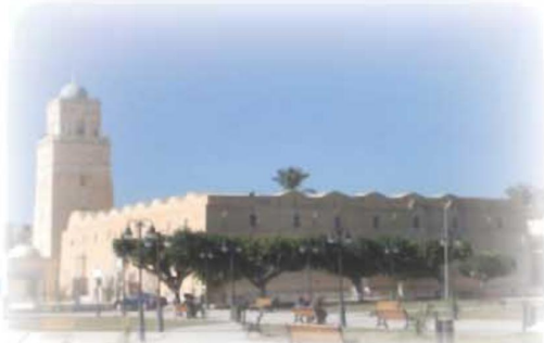
جامع مراد آغا اليوم بمندنتته الجديدة

فانتعشت الحياة الاقتصادية في البلاد ولم تطل مدة