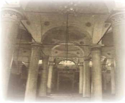
مشهد من الداخل

أَشْتَرَكَ مَعَ الْقُوَّاتِ الْعُثْمَانِيَّةِ فِي حِصَارِ جَزِيرَةِ مَالِطَةَ، وَلَكِنَّهُ اسْتَشْهَدَ فِي أَثْنَاءِ الْحِصَارِ، وَنُقِلَ جُثْمَانُهُ إِلَى طَرَابُلُسَ حَيْثُ دُفِنَ فِي جَامِعِهِ .