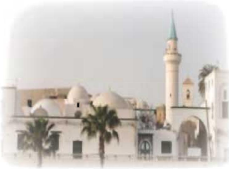
جامع درغوث باشا