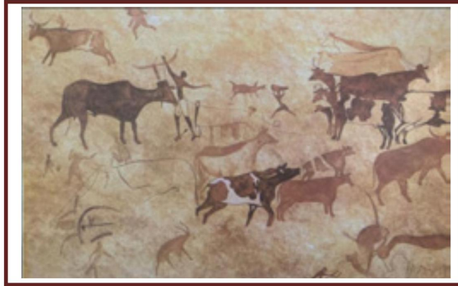
شكل رقم 3)

ونتيجة لاستئناس الحيوانات بدأت حرفة الرعي وتربية الحيوانات تسير جنباً إلى جنب مع الزراعة .