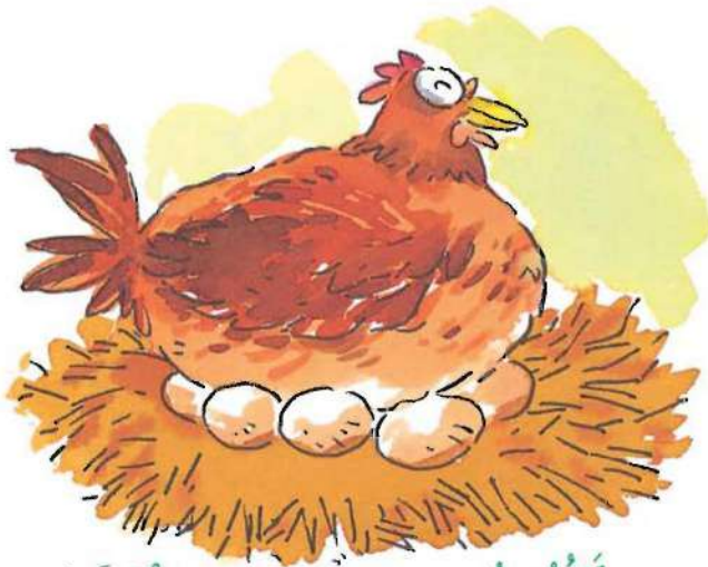
ترقد الطيور على البيض حتى يفقس.

تضع بعض الحيوانات بيضاً. وبعد وضع البيض، تبدأ الفراخ في النمو داخله. الفراخ تنقُر بعد فترة البيض فيفقس وتبدأ في الخروج.