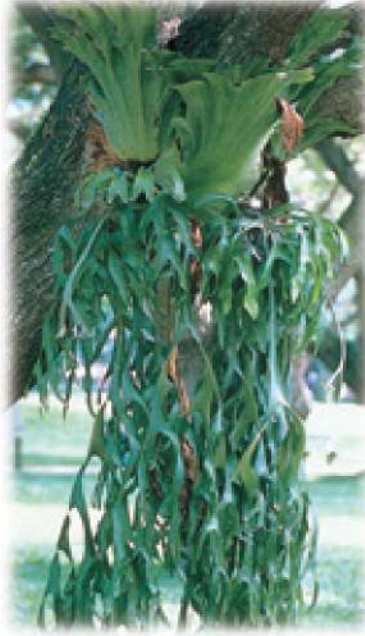
سَرَخْسُ قَرْنِ الْإَيْلِ