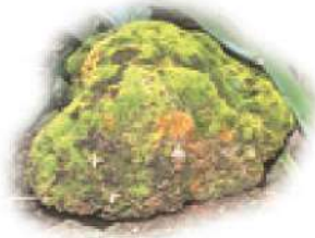
طُحْلَبٌ عَلَى صَخْرَةٍ