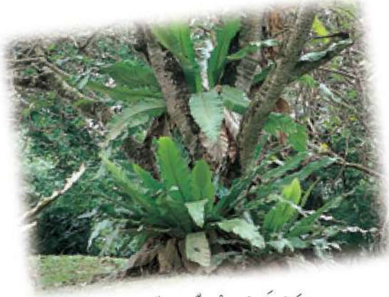
سَرَخْسُ عَشِّ الطَّائِرِ