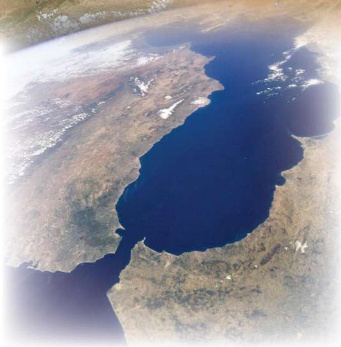
صُورَةٌ (24) مَضِيقُ جَبَلِ طَارِقِ