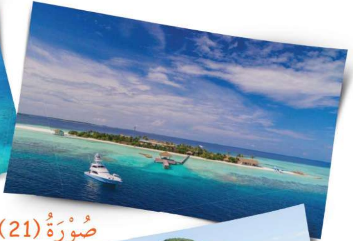
صُورَةٌ (21) الْجَزَرُ وَسَطَ الْبَحْرِ