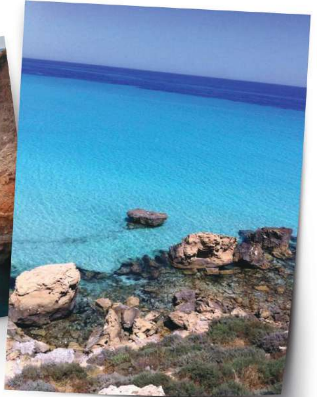
صُورَةٌ (20) الْبَحْرُ