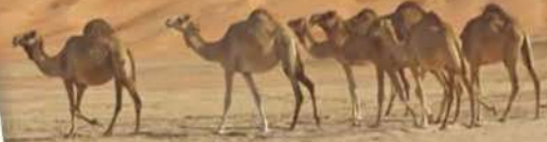
صحراء لوط بإيران