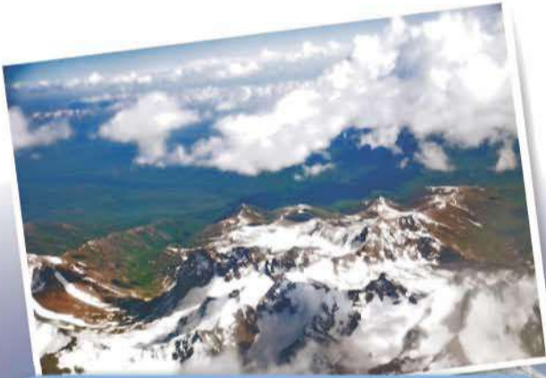
صورة (44) جبال البامير

تمتد من وسط آسيا من الغرب إلى الشرق على شكل سلاسل جبلية عظيمة تتخللها عدة هضاب ، وأهم هذه الجبال هي طوروس ثم جبال القوقاز وتنحصر بينهما هضبة أرمينيا ومنها تتفرع الجبال إلى سلسلتين شمالية وجنوبية ، وجبال البرز المشرفة على بحر قزوين في الشمال، وجبال زاغروس في الجنوب التي تتصل بجبال سليمان وهندكوش ثم تلتقي السلسلتان الجبلتان مرة ثانية في عقدة بامير، وتتفرع من هذه الهضبة سلاسل جبلية تتجه نحو الجنوب الشرقي أهمها جبال الهيمالايا التي ترتفع إلى 8848 متراً في قمة أفرست كما تتفرع من عقدة البامير سلاسل جبلية تتجه نحو الشمال الشرقي أهمها جبال التين تاج وتيان شان وجبال التاي التي تحصر بينها صحراء جوبي وهضبة التبت أوسع وأعلى هضاب العالم ثم تواصل الجبال امتدادها نحو الشرق جنوب سيبيريا. انظر الصور (43، 44، 45)