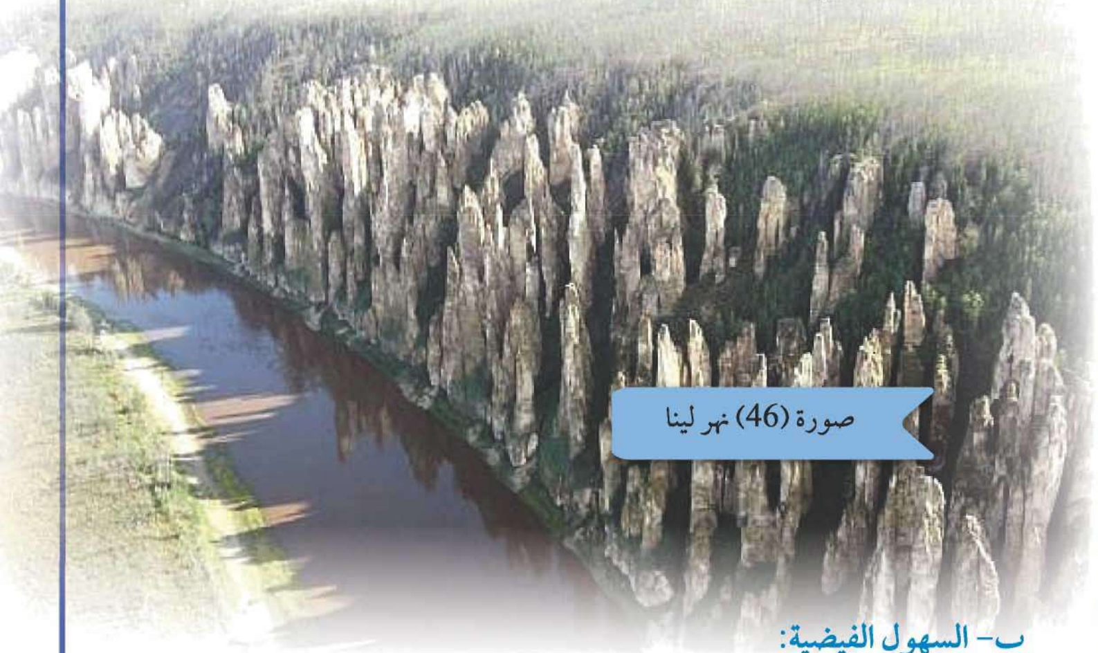
صورة (46) نهر لينا

المعروفة بسهول سيبيريا وهي على شكل مثلث في شمال القارة تتسع في الغرب وتضيق في الشرق، وتنحدر نحو الشمال مكسوة بالغابات ، يخترقها العديد من الأنهار التي تتجه نحو الشمال وتصب في المحيط الشمالي أهمها نهر لينا (صورة 46) وينسي وأوب، وفي الجنوب الغربي يجري نهر سيحون وجيحون اللذان يصبان في بحر أورال.