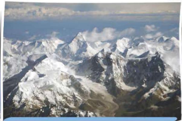
صورة (43) جبال تيان شان