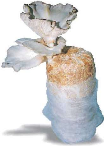
عَيْشُ الْغُرَابِ يَنْمُو عَلَى نِشَارَةِ خَشَبٍ

هَلْ رَأَيْتَ عَفْنًَا عَلَى خُبْزٍ أَوْ فَاكِهَةٍ أَوْ شِيكُولَاتَةٍ؟ مَاذَا عَنِ عَيْشِ الْغُرَابِ عَلَى جُدُوعِ الْأَشْجَارِ، وَنُشَارَةِ الْخَشَبِ؟