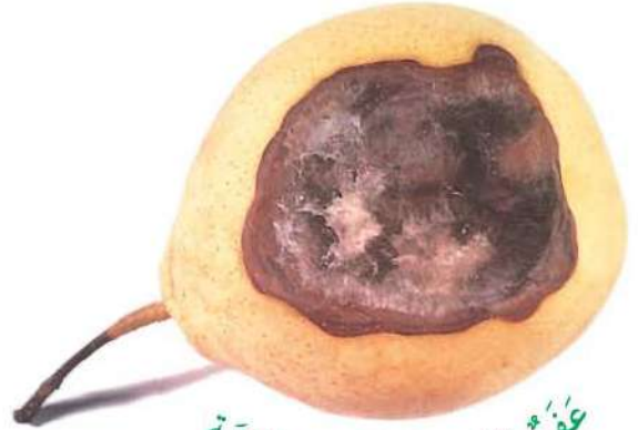
عَفْنٌ يَنْمُو عَلَى ثَمَرَةِ فَاكِهَةٍ

الْعَفْنُ هُوَ نَوْعٌ مِنَ الْفِطْرِ. وَهُوَ يَتَغَدَّى عَلَى كَثِيرٍ مِنَ الْأَطْعِمَةِ الَّتِي تَأْكُلُهَا. وَلَا يَأْكُلُ الْعَفْنُ تِلْكَ الْأَطْعِمَةَ كَمَا تَفْعَلُ. فَإِنَّهُ يُكَسِّرُ الطَّعَامَ أَوَّلًا ثُمَّ يَمْتَصُّ الْمَوَادَّ الْمُغَذِّيَّةَ.