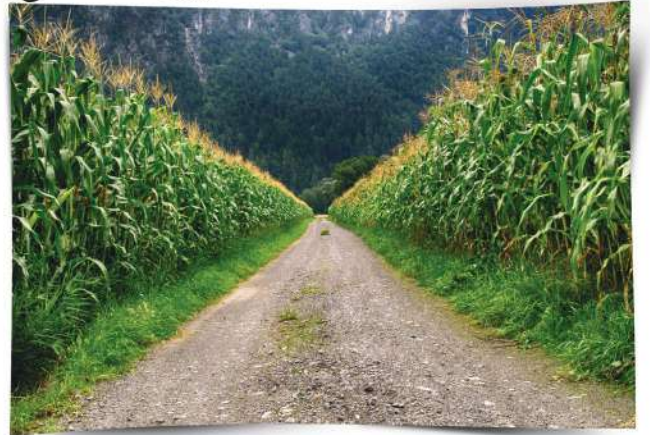
صُورَةٌ (33) حَقْلُ نَبَاتِ الذُّرَّةِ