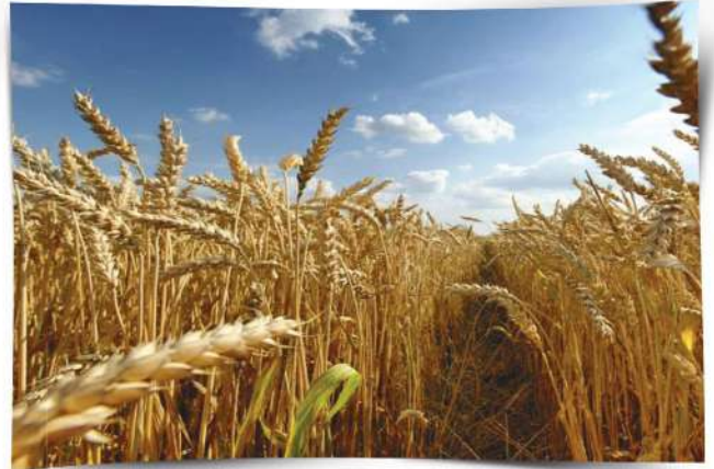
صُورَةٌ (30) حَقْلُ قَمَحٍ أَوْ شَعِيرٍ