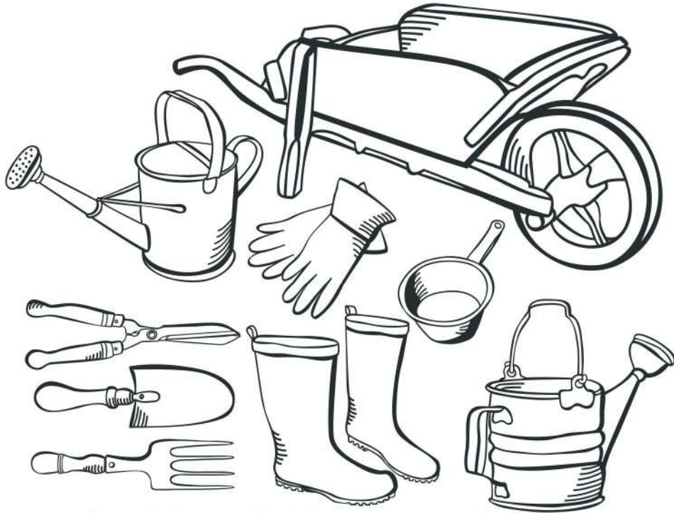
صُورَةٌ (27) الأَدَوَاتُ الزَّرَاعِيَّةُ الْقَدِيمَةُ

مِثْلُ: الْمِخْرَاطِ الْخَشَبِيِّ وَالْمِنْجَلِ وَالْفَأْسِ وَالْمُشْطَ وَهَذِهِ تُسْتَعْمَلُ فِي الْمَسَاحَاتِ الزَّرَاعِيَّةِ الصَّغِيرَةِ وَحَيْثُ تَكْثُرُ الْأَشْجَارُ.