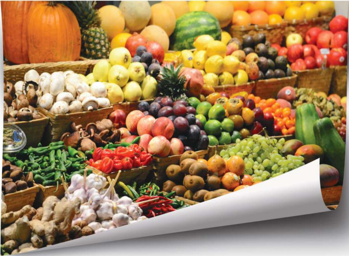
صُورَةٌ (26) مُتَّجَاتُ زَرَاعِيَّةٌ

وَهِيَ حِرْفَةٌ رَيْسِيَّةٌ تَشْتَغَلُ بِهَا مَجْمُوعَةٌ مِّنَ السُّكَّانِ وَالزَّرَاعَةُ تُوفِّرُ لَنَا الْمَوَادَّ الَّتِي نَحْتَاجُهَا لِغَدَائِنَا وَتُعَرِّفُ هَذِهِ الْمَوَادُّ بِالْمَحَاصِيلِ الزَّرَاعِيَّةِ، وَتَشْتَمِلُ (الْحُبُوبَ وَالْفَوَاكِهَ وَالْخُضْرَوَاتِ)، وَالزَّرَاعَةُ تَحْتَاجُ إِلَى أَعْمَالٍ كَثِيرَةٍ مُتَعَدِّدَةٍ مِثْلَ الْحَرْثِ، وَالتَّسْوِيَةِ، وَالْبَذْرِ، وَالتَّسْمِيدِ وَالْعِنَايَةَ بِالنَّبَاتَاتِ وَتَحْتَاجُ الزَّرَاعَةَ إِلَى كَمِّيَّةٍ مِّنَ الْمِيَاهِ الصَّالِحَةِ.