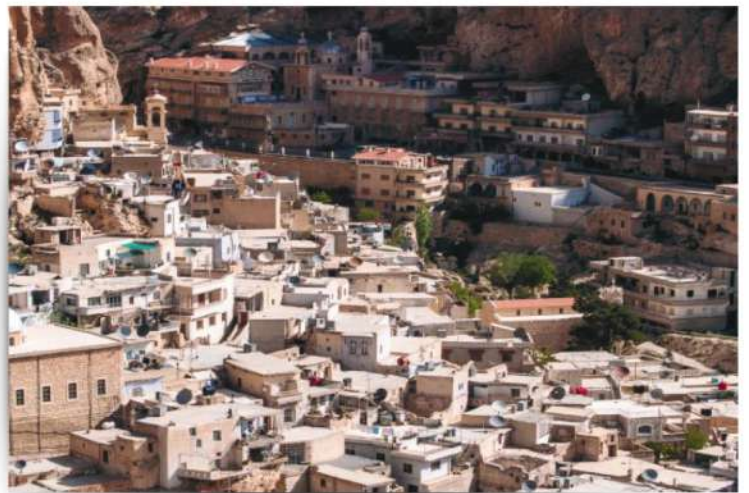
صُورَةٌ (25) مَنَظَرٌ عَامٌّ لِلْقَرْيَةِ