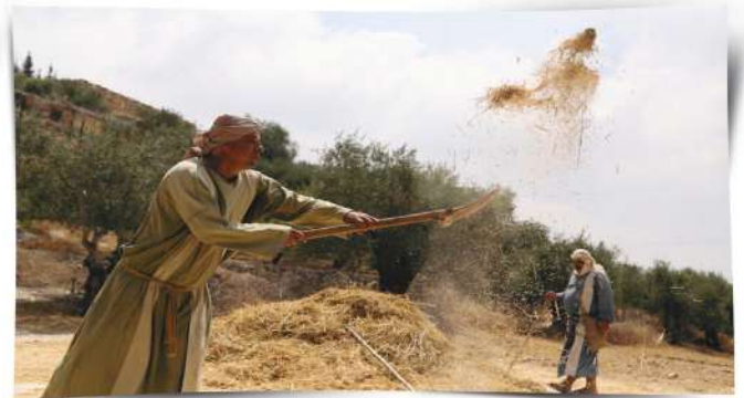
صُورَةٌ (31) فَصْلُ الْحُبُوبِ بِالطَّرِيقَةِ الْقَدِيمَةِ