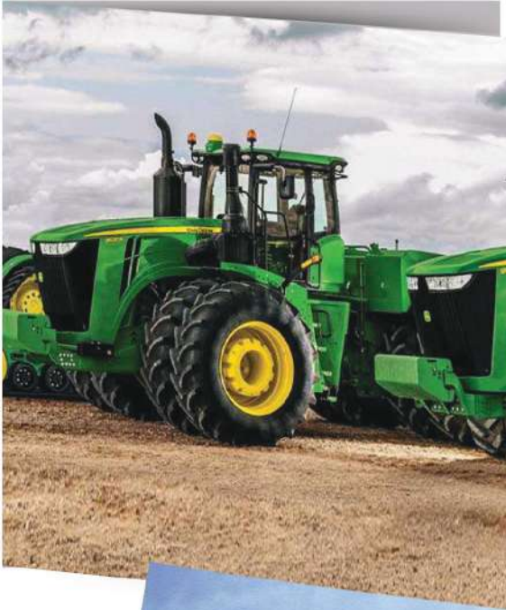
صُورَةٌ (29) الْجَرَّارُ مِنَ الْأَدَوَاتِ الْحَدِيثَةِ

مِثْلُ: الْجَرَّارَاتِ، لِحَرْثِ وَ تَسْوِيَةِ الْأَرْضِ وَبَذْرِ الْبُذُورِ وَالْحَصَادَةِ الْحَدِيثَةِ لِحِصَادِ الْمَحْصُولِ وَفِضْلِ الْحُبُوبِ، كَمَا تُسْتَعْمَلُ طُرُقُ الرَّيِّ الْحَدِيثَةِ (كَالرِّيِّ الدَّائِرِيِّ أَوْ التَّنْقِيطِ) وَاسْتِخْدَامِ الطَّائِرَاتِ فِي رَشِّ الْمُبِيدَاتِ الْحَشْرِيَّةِ وَمُقَاوَمَةِ الْأَفَاتِ الزَّرَاعِيَّةِ، وَهَذِهِ الْأَلَاتُ سَاهَمَتْ فِي تَوْفِيرِ الْجُهْدِ وَالْوَقْتِ وَزِيَادَةِ الْإِنْتِاجِ.