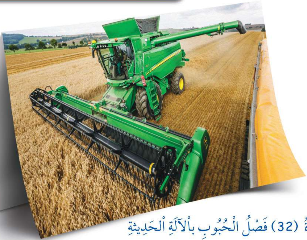
صُورَةٌ (32) فَصْلُ الْحُبُوبِ بِالْآلَةِ الْحَدِيثَةِ

هِيَ الْمَصْدَرُ الرَّئِيسِيُّ لِتَغْذِيَةِ هَذَا النُّوعِ مِنَ الْمَرْزُوعَاتِ وَيَنْضَجُ الْقَمْحُ وَالشَّعِيرُ فِي أَوَاخِرِ فَصْلِ الرَّبِيعِ حَيْثُ يَتَمُّ حَصَادُ الْمَحْضُولِ وَتَجْفِيفُهُ ثُمَّ فَصْلُ الْحُبُوبِ عَنِ التَّبْنِ، بِالطَّرِيقَةِ الْقَدِيمَةِ أَوْ بِوَاسِطَةِ الْآلَاتِ الْحَدِيثَةِ.