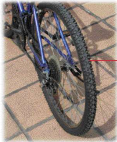
الأشْكَالُ المَحْفُورَةُ عَلَى إطاراتِ الدَّرَاجَةِ

وَتُسَاعِدُ الأشْكَالُ المَحْفُورَةُ عَلَى إطاراتِ المَرْكَبَةِ فِي بَقَائِهَا فَوْقَ الطَّرِيقِ، وَتَمْنَعُهَا مِنَ الانزلاقِ فِي حَالَاتِ البَلَلِ، كَمَا تُسَاعِدُ هَذِهِ الأشْكَالُ المَرْكَبَةَ فِي الإِبْطَاءِ وَالتَّوَقُّفِ عِنْدَ اسْتِخْدَامِ المَكَابِحِ.