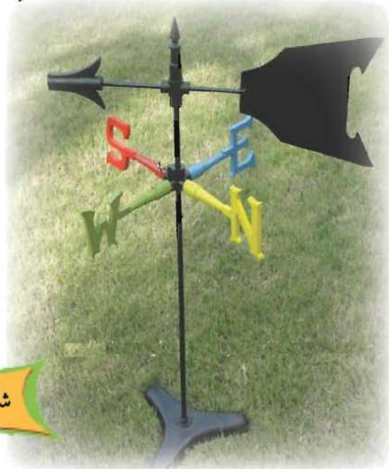
شكل (27) دورة الرياح

الرِّيحِ تُسَمَّى الرِّيحِ عَادَةً بِاسْمِ الْجِهَةِ الَّتِي تَهْبُ مِنْهَا فَعِنْدَمَا تَهْبُ الرِّيحُ مِنْ جِهَةِ الشَّمَالِ، تُسَمَّى الرِّيحُ شَمَالِيَّةً.