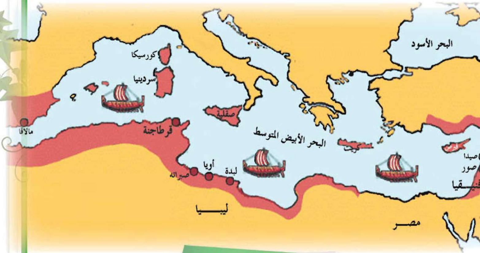
شكل (35) المراكز التجارية الفينيقية في شمال إفريقيا

وقد استقر الفينيقيون في هذه المحطات التجارية تفاديًا للغارات التي شنها الآشوريون، والفرس، والإغريق على بلادهم فينيقيا . وتعتبر قرطاجنة، من أشهر المدن التي أسسها الفينيقيون في شمال إفريقيا .