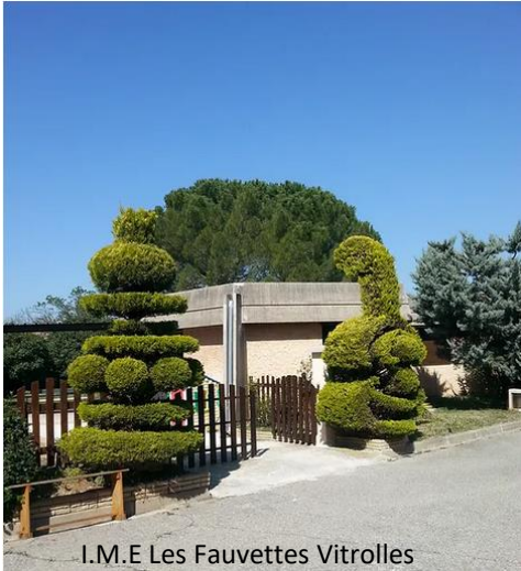
I.M.E Les Fauvettes Vitrolles