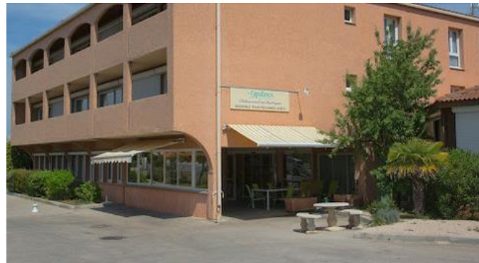
Résidence Les Jardins de Valtredes Chateaufort les Martigues