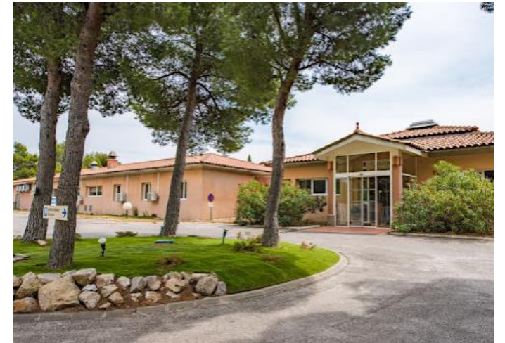
Résidence Les Jardins de Valtredes