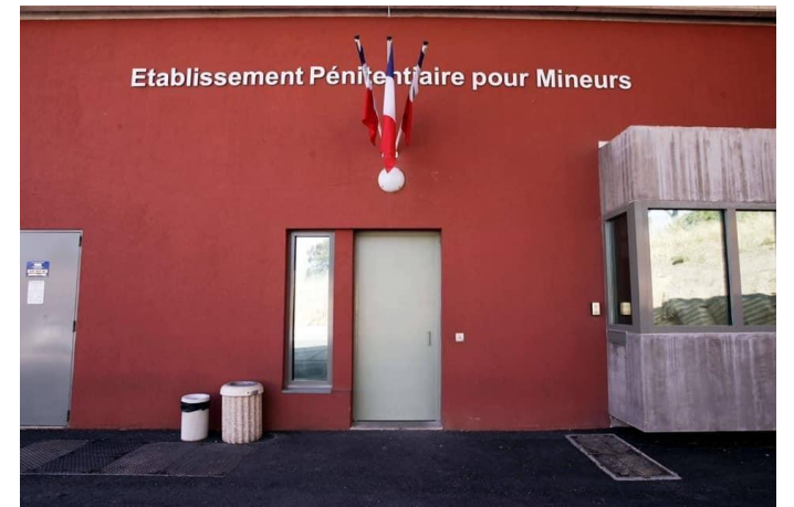
Marseille La Valentine