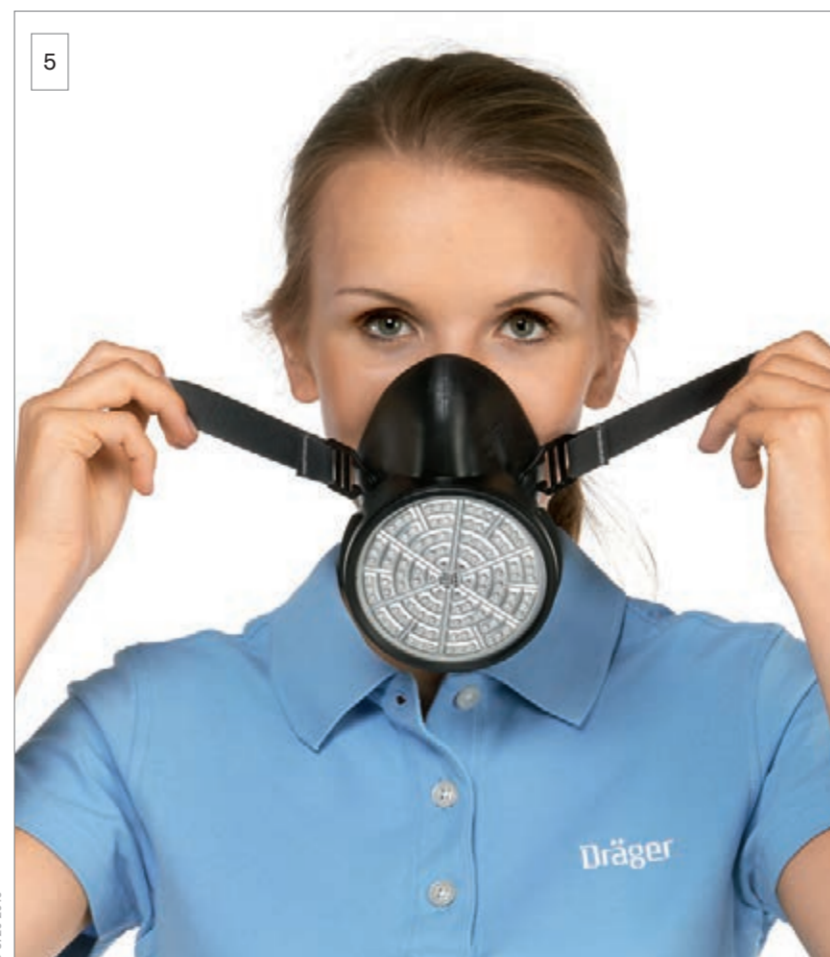
5 Hold the half mask by the straps and pull it over your nose and mouth with your chin in the chin well.