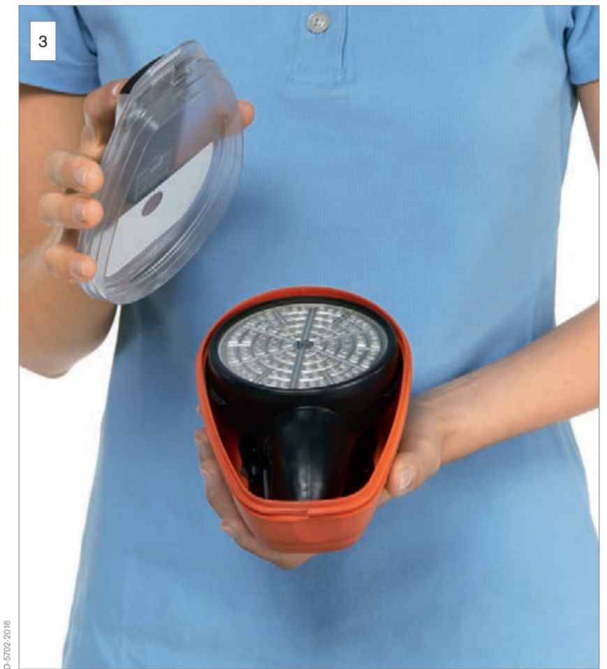
3 Öffnen Sie die Verpackung.