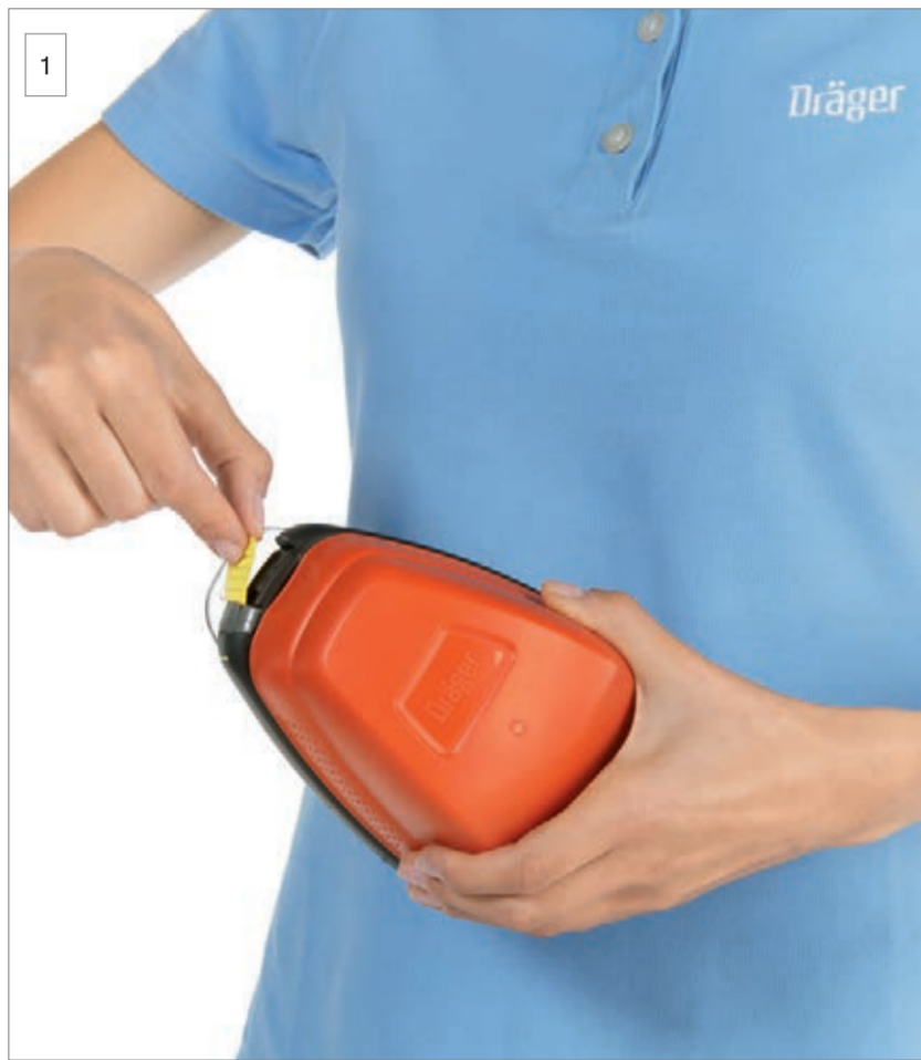
1 Reißen Sie die Plombe mithilfe der Lasche auf.