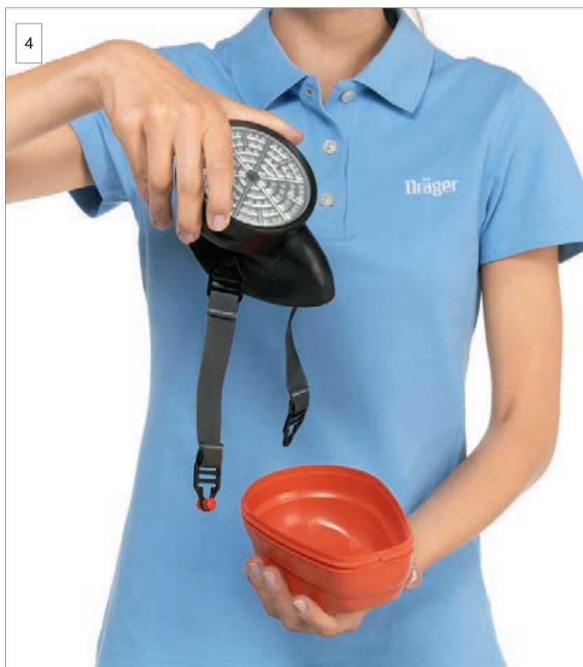
4 Entnehmen Sie das Gerät.