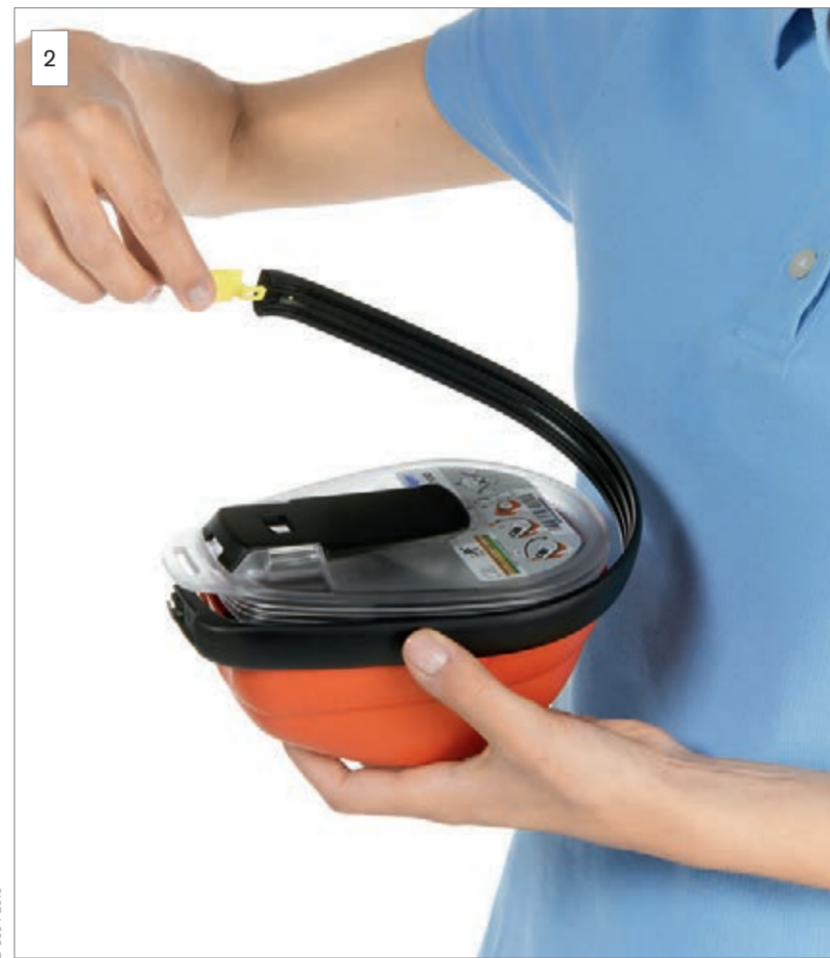
2 Remove the sealing band.