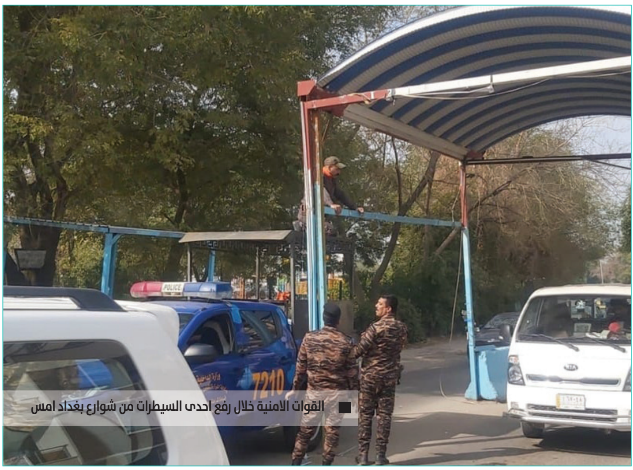
القوات الامنية خلال رفع احدى السيترات من شوارع بغداد امس

من جانبه، أشاد القاضي حيدر حنون بـ«دعم رئيس الجمهورية لعمل الهيئة»، مشيراً إلى «الصعوبات التي تعيق عملها والسبل الكفيلة برفع مستوى أدائها وبما يخدم ترسيخ القانون في البلاد وتأمين مصالح الشعب، وبين أن (النزاهة) استطاعت خلال هذه الفترة من استرداد أموال كبيرة تعود لزمن النظام السابق إضافة إلى معالجة الكثير من ملفات الفساد في السنوات الأخيرة بما ساعد على استعادة أموال منهوبة وإحالة مطلوبين إلى القضاء».