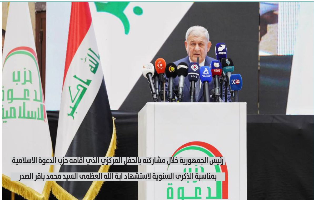
رئيس الجمهورية خلال مشاركته بالحفل المركزي الذي اقامه حزب الدعوة الاسلامية بمناسبة الذكرى السنوية لاستشهاد اية الله العظمى السيد محمد باقر الصدر