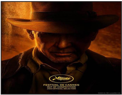
المواطن - متابعة

فيلم Indiana Jones and Dial of Destiny للنجم هاريسون فورد- وهو أول فيلم لسلسلة Indiana Jones منذ عام 2008- سيُعرض للمرة الأولى عالمياً في مهرجان كان السينمائي. الفيلم المتوقع أن يكون آخر أفلام فورد في سلسلة مغامرات الحركة الطويلة سيرج من المنافسة في المهرجان. بعد 15 عاماً استعاد هاريسون فورد قبضته وسوطه من أجل هذا الفيلم الجديد الذي أخرجه جيمس مانغولد. سيُقدم له المهرجان تكريماً استثنائياً طوال مسيرته المهنية. الفيلم وهو الخامس من اللوحة سيُعرض في 28 حزيران في فرنسا و 30 منه في الولايات المتحدة. وشارك المخرج جيمس مانغولد حماسته عرض الفيلم في المهرجان بعد 28 عاماً من عرض فيلمه Heavy عام 1995، للمرة الأولى أيضاً في المهرجان.