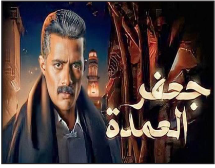
المواطن - متابعة

خلال الساعات الماضية وبالتحديد بعد عرض الحلقة الخامسة عشرة، تصدر المسلسل مواقع التواصل الاجتماعي، حيث ظهرت الفاتنة لبنى ونيس، التي تجسد شخصية فاطمة، وهي المرأة التي تعرف هوية نجل جعفر رئيس البلدية، حيث قامت بتربيته بعد اختطافه، ويحاول رمضان أن يعرف منها طوال الحلقات الماضية من هو ابنه، لكنها تراوغه. سخر رواد مواقع التواصل الاجتماعي من هذا المشهد، حيث أكدوا أنه مأخوذ من فيلم «العفاريت» الذي أنتج العام 1990، من بطولة مديحة كامل وعمرو دياب، حيث توفيت المرأة التي خطفت ابنتها من المستشفى من دون الكشف عن هويتها.