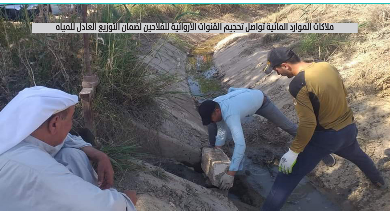
ملاكات الموارد المائية توامل تحجيم القنوات الأروائية للفلاحين لضمان التوزيع العادل للمياه

مع أولويات الحكومة وجددنا الدعوة إلى تحويل حالة الاستقرار الحالية إلى حالة دائمة، وبيّنا أن الاستقرار الدائم ليس نتاجاً لحركة الحكومة فحسب وإنما يتحقق بتضافر جهود الجميع من حكومة وقوى سياسية وفاعليات اجتماعية واقتصادية». وتابع: «أكدنا أيضاً أهمية الانفتاح العراقي على محيطه العربي والإسلامي والمجتمع الدولي، حيث أثبت العراق صدق نواياه وتوجهاته بأن يكون مع الجميع ومع حل الخلافات باعتماد الحوار والبحث عن المشتركات، وأكدنا أن نظرة العالم للعراق تتغير بفعل التطور الذي يشهده سياسياً واجتماعياً واقتصادياً وأمنياً».