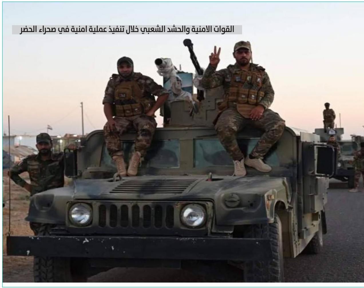
القوات الامنية والحشد الشعبي خلال تنفيذ عملية امنية في محراء الحضر

وأضاف أن «الخطط الموجودة لدى هيئة السياحة تحتاج إلى المزيد من التخصيصات المالية، وكذلك تحتاج إلى شبكة من الإجراءات بالتعاون مع المؤسسات الحكومية والمحلية ومجالس المحافظات ووزارة النقل وشبكات الطرق وغيرها بوصفها مشروعاً وطنياً». وتابع، أن «هناك نقلة نوعية في عمل هيئة السياحة، حيث كانت الهيئة خاسرة والأّن أصبحت رابحة بسبب الخطط والسياسات المتبعة مع وجود العديد من (الكرويات) السياحية من خارج العراق».