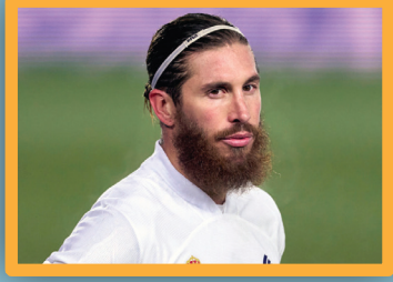
سيويو راموس على أعتاب الانضمام للدوري التركي