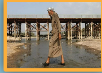
معضلة عرض المياه في العراق وإشكالية إدارة الطب

3 ص 3 ص وزيرة المالية توقع مع السفارة اليابانية الدفعة الخامسة من قرض تطوير مصفى البصرة المنتجات النفطية تكشف عن خطتها لزيارة الزبوعين