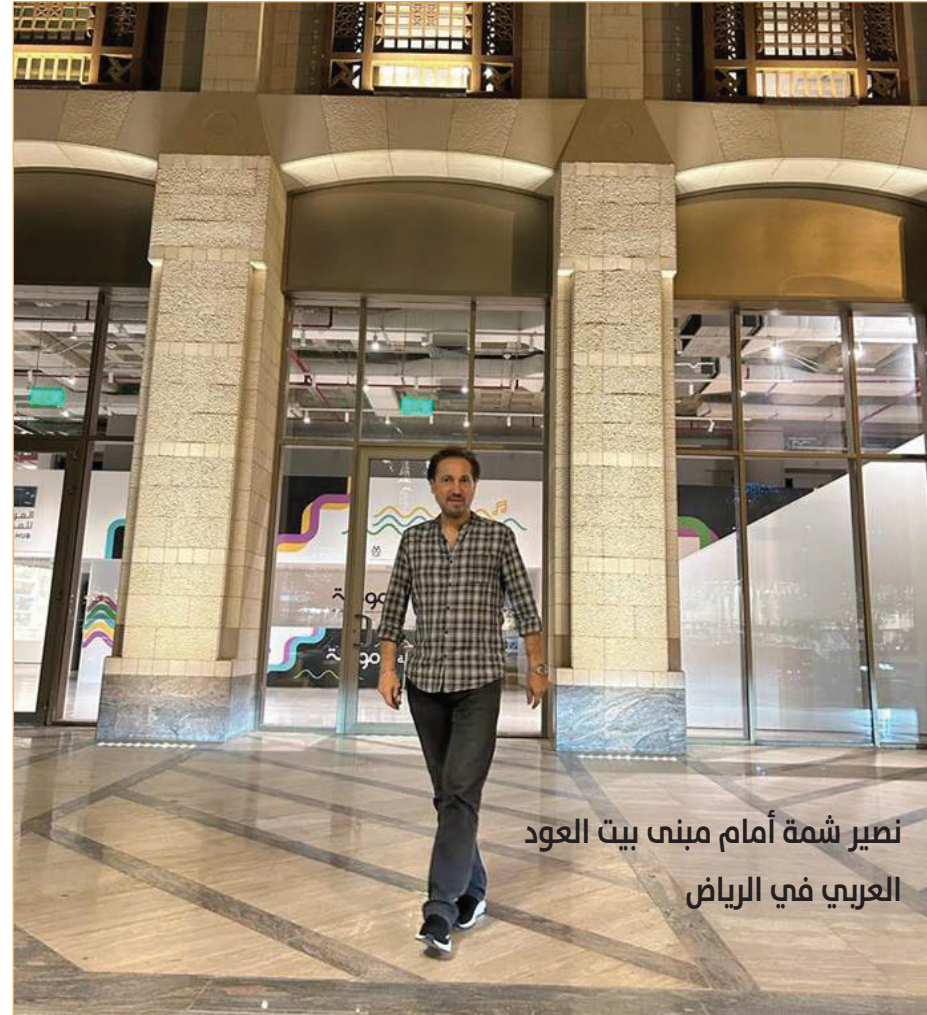
نصير شمة أمام مبنى بيت العود العربي في الرياض

وفي لقاء سريع مع الموسيقار العالمي نصير شمة تحدث لنا عن آخر مبادراته ومشاريعه وحراكه الإبداعي المتواصل فقال: «لدي أشياء كثيرة في هذه المدة لكن الظروف التي تمر بها غزة وفلسطين تجعلنا لا ننشر أي شيء في أي شخصي احتراماً للشهداء والجرحى، فالشعب الفلسطيني يدفع ثمننا باهظاً جداً، هناك وحشية كبيرة تقود العالم: كأننا عدنا عصوراً الى الوراء، انقسم العالم وسقطت الإنسانية مع إبادة آخر ما تبقى من الإنسانية.» مضيقاً، لكنه تم - مؤخرًا - افتتاح (بيت العود العربي) في الرياض مع هيئة الموسيقى التابعة لوزارة الثقافة في المملكة العربية السعودية، وكانت مفاجأة بتقدم عدد كبير جداً أكثر من توقعاتنا بكثير، زاد عددهم على أكثر من (1000) طالب قدموا للدراسة في بيت العود لتلقي الدروس التعليمية في العزف على العود أو صناعته، ولغاية الآن تمكنتا من اختيار أربعمائة طالب وقبول نسبة منهم، وبدأت الدراسة فعلاً بأساتذة هم من خريجي بيوت العود الأخرى، من الدول العربية العراق، ومصر، وسوريا، وفي الدول العربية الأخرى. وأوضح «إن شاء الله تعالى سيكون (بيت العود العربي) في الرياض نافذة كبيرة بأهداف كثيرة ومنها اهتمامه بموسيقى البلد المضيف وتراثه الثقافي، ولقد أدخلنا المزيد من الآلات الموسيقية في هذا المشروع العربي إلى جانب تركيزه على آلة العود، ليمنح الطلاب حرية الاختيار لأحد الآلات التقليدية مثل العود، والقانون، والبرق والساز، والكمان، والسناي، والإيقاعات، أو الآلات المبتكرة من قبل الموسيقي، دون توقف...»