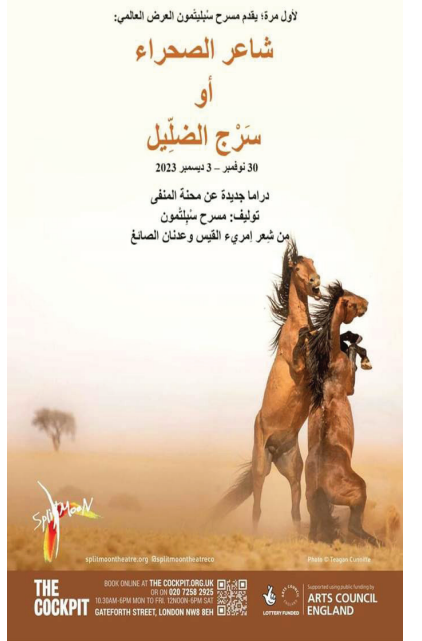
الأول مرة، يقدم مسرح سبليتمون العرض العالمي: شاعر الصحراء أو سرج الضليل

العروض سيقدم في خمسة عروض، أولها في تمام الساعة السابعة والنصف مساء يوم الخميس الثلاثين من تشرين الثاني (نوفمبر) الحالي، وفي التوقيت ذاته يقدم مساء يوم الجمعة الأول من كانون الأول (ديسمبر) المقبل، ويقدم العرض مرتين أخريين في تمام الساعة الثالثة مساءً، والساعة السابعة والنصف مساء يوم السبت الثاني من كانون الأول (ديسمبر) المقبل، ويعد العرض في تمام الساعة الرابعة والنصف مساء يوم الأحد الثالث من كانون الأول (ديسمبر) المقبل.