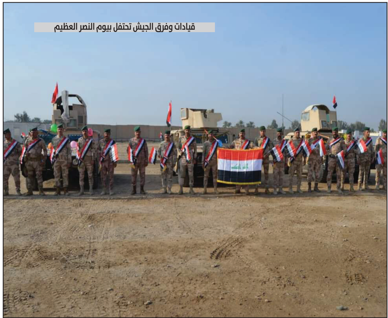
قيادات وفرق الجيش تحتفل بيوم النصر العظيم

الذي لا يمكن أن نسمح لأحد أن يفرط به، بأي حال من الأحوال». والدماء الطاهرة التي أريقته من أجل البلد». فيما قال رئيس الوزراء محمد شياع السوداني، في كلمته بمناسبة الذكرى السادسة للانتصار الكبير على عصابات داعش الإرهابية، «نستذكر هذا النصر التاريخي، الذي تمكن فيه العراقيون من دحر داعش وإرهابها، نيابة عن العالم والإنسانية جمعاء، ونستحضر بإجلال وإكبار، عناوين التضحية لشهدائنا الأبطال، ومعهم قادة النصر، الذين ما كنا نرى الحرية والانتصار والعيش الآمن إلا بتضحياتهم العظيمة».