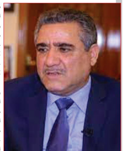
الجزء الثاني والاخير

بالأمور الحسابية ومسك الدفاتر ومعرفتها اللغة الانكليزية.. حتى وصل منهم الى درجة رفيعة (نائب المدير العام) وبعد نقل ملكية هذا المرفق الى الحكومة العراقية... وعند جنسب محطة غربي بغداد شيّدوا بناية كبيرة جدا عالية السقف (اللوكة) وهي غسسل وفحص وتزييت القاطرات والتي كثيرا ما تلفت محاصيلنا الزراعية نتيجة (ماء الغسيل اللوث) والممزوج بالنفط والزيت ولان نهاية مجراه بحدود بستان السيد خضير العباس التي هي على مقربة من هذا المأوى. ظلت ملكية هذا المرفق الحيو وادارته بيد الانكليز لمدة طويلة من الزمن... وبعد مفاوضات ومباحثات عدة ومعقدة تم نقل ملكيتها الى الحكومة العراقية وكان اخر مدير عام (انكليزي) لهذه المؤسسة هو المستر (سمث) وبعده تسلمت ادارتها شخصيات عراقية وطنية... واول ما فكرت به هو انشاء محطة مركزية كبيرة على غرار محطة لندن حيث تكون منطلقا لجميع خطوط السكك في العراق.. ورسا مشروع المحطة العالمية في نهاية الاربعمينات على شركة انكليزية هي (Hallway Brothers)