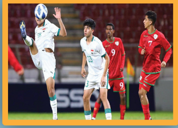
منتخب ناشئي العراق يتاهل الى نصف نهائي بطولة غرب آسيا