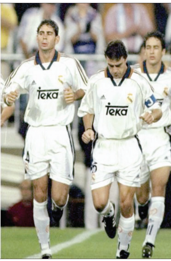
المواطن - وكالات

رصدت صحيفة "ماركا" الإسبانية عددا من أندية كرة القدم العريقة التي لم تغادر دوري الدرجة الأولى منذ تأسيسها مثل ريال مدريد وبرشلونة أو تلك التي لم تهبط منذ عقود. وهبط نادي سانتوس البرازيلي إلى الدرجة الثانية لأول مرة في تاريخه منذ ١١١ عاما بخسارته أمام منافسه فورتاليزا (١-٢)، الأمر الذي تسبب بفوضى كبيرة في الشوارع وغضب من جماهير النادي.