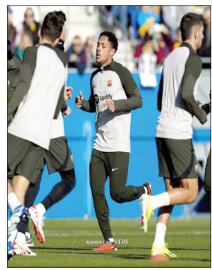
المواطن - وكالات

حاولت إدارة مانشستر سيتي الإنجليزي الحصول على توقيع أحد اللاعبين الحاليين في صفوف برشلونة الإسباني، قبل انضمامه للفريق الكتلوني. وكان البارسا قد وقع مع المهاجم البرازيلي فيكتور روكي قادما من أتلتيكو بارانينسي في الصيف الماضي، لكن ظل اللاعب في النادي البرازيلي لمدة ٦ أشهر على سبيل الإعارة، قبل الانتقال إلى البارسا هذا الشهر. ووفقا لصحيفة "موندو ديبورتيفو" الإسبانية، حاول مانشستر سيتي التوقيع مع روكي بأي ثمن قبل أن ينجح برشلونة في حسم الصفقة. وأشارت الصحيفة الإسبانية إلى أن روكي قاوم إغراءات السيتي، لأن رغبته الوحيدة في أوروبا كانت اللعب مع برشلونة، لذلك رفض العرض المقدم من بطل دوري أبطال