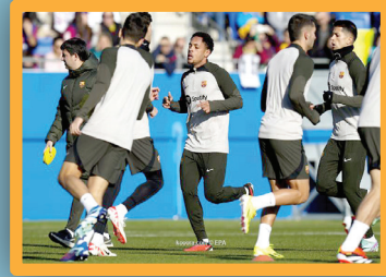
إغراءات مانشستر سيتي تفشل أمام برشلونة

3 ص وزير الاتصالات تعلن مشروع طريق الحضارات وإدخاله التشغيل التجاري