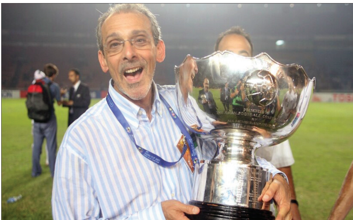
المواطن - متابعة

تاريخ المشاركات العراقية . وتقدم القائمة المدرب العراقي عبد الإله محمد الذي يعتبر أول مدرب قادم منتخب العراق في بطولات كأس آسيا عام ١٩٧٢، بينما يعد المدرب اليوغسلافي لينكو غاريتش ثاني مدرب قاد منتخب العراق في النهائيات الآسيوية عام ١٩٧٦. وعاد العراق يشارك في البطولات الآسيوية بعد رفع العقوبة الدولية عقب اجتياح العراق للكويت ليشارك في نهائيات آسيا من جديد عام ١٩٩٦ بقيادة المدرب يحيى علوان الذي لفق حينها بتدريب المنتخب الوطني، بينما قاد المدرب الصربي ميلان زيفاديفيتش المنتخب العراقي في عام ٢٠٠٠. وفي عام ٢٠٠٤ قاد المنتخب