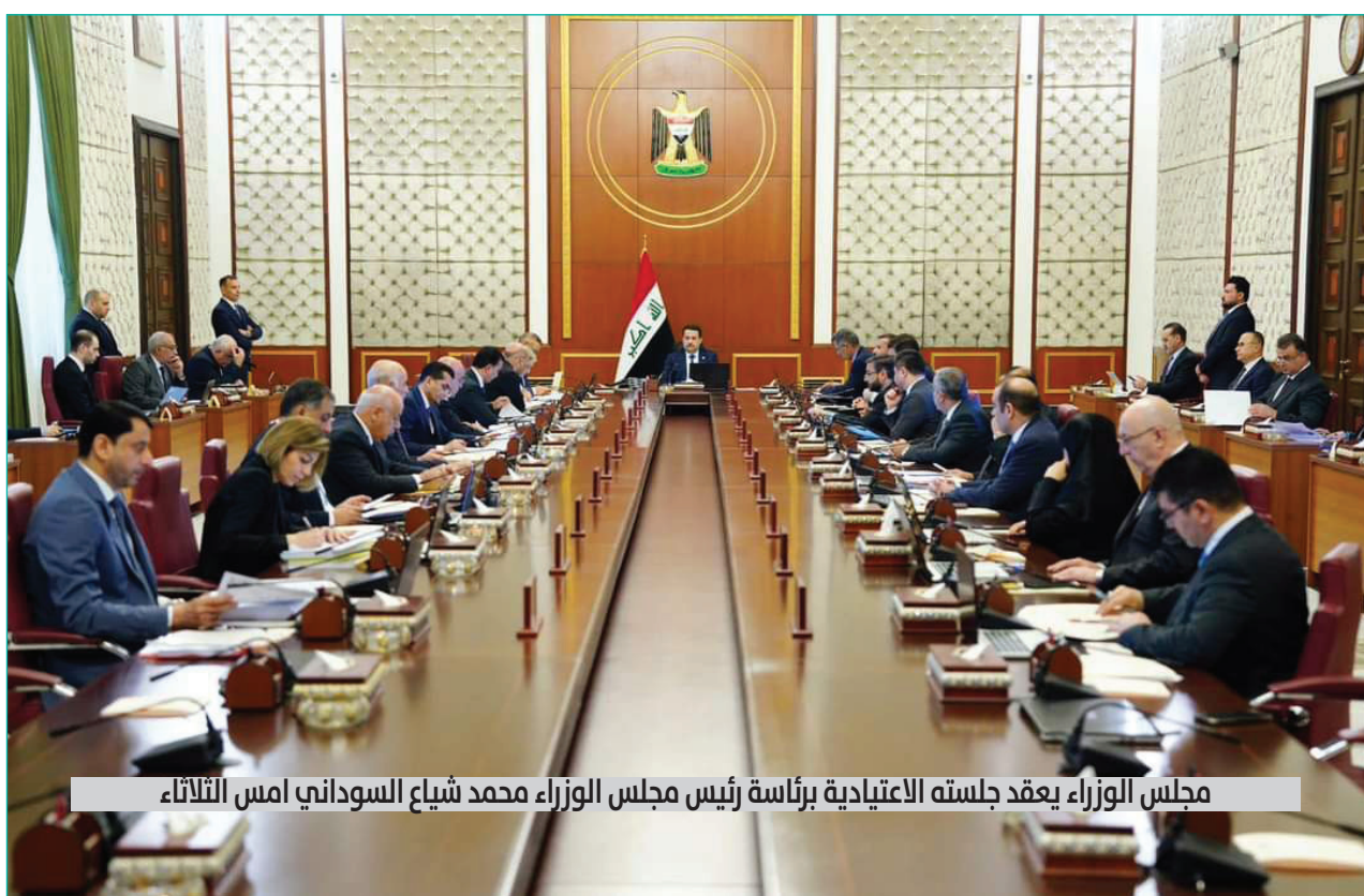
مجلس الوزراء يعقد جلسته الاعتيادية برئاسة رئيس مجلس الوزراء محمد شياع السوداني امس الثلاثاء

واصدار العملة، وتنظيم السياسة التجارية عبر حدود الاقاليم والمحافظات في العراق ورسم للاقتصاد، لكن تنفيذ هذه السياسة وتحديد آليات التنفيذ تدخل ضمن صلاحيات الإقليم». من جانبه أشار رئيس المحكمة الاتحادية العليا أن «المحكمة ملتزمة بما اتفق عليه المؤسسون للعملية السياسية، وما جرى تدوينه في دستور ارتضاه العراقيون، نظم العلاقة بين السلطات الاتحادية والإقليم، وأن المحكمة الاتحادية العليا حريصة على تنفيذ ما ورد في الدستور والتشريعات النافذة، وأنها ستكون الداعم الأول لسيادة مبادئ الشريعة والمشرعية، وستكون الأمين الحامي لحقوق الشعب والوفية لدماء الشهداء».