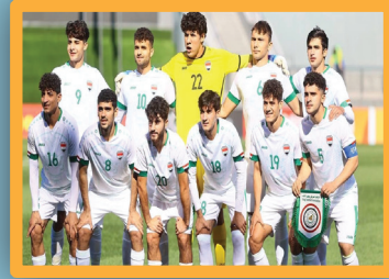
7 ص اليوم.. شباب العراق يواجه الولايمي الاسترالي في بطولة غرب آسيا تحت 23 عاما

تابعونا على :- الموقع الإلكتروني ( ويب سات ) عبر الرابط: https://www.almowatennews.net - التليغرام عبر الرابط: https://t.me/almowatennew - الإنستغرام عبر الرابط: https://www.instagram.com/almowatennews - التويتتر عبر الرابط: https://twitter.com/almowaten_news www.almowatennews.net