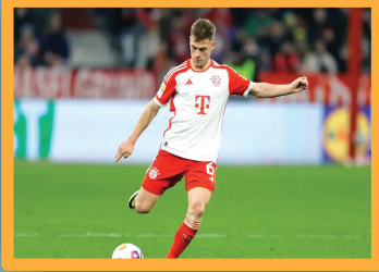
برشلونة بييغ كيميشتش بشرط ضمه