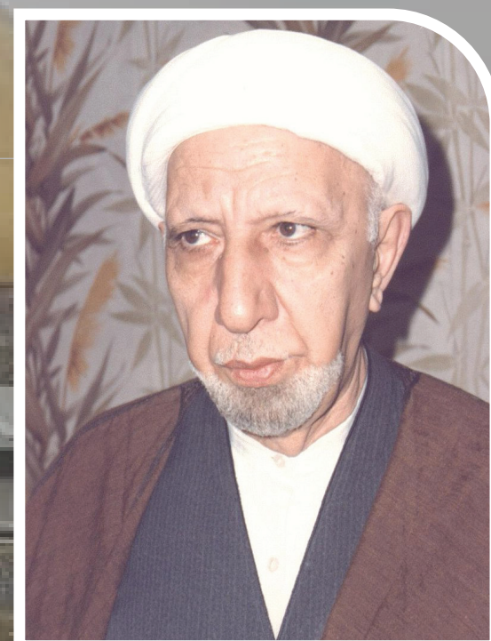
الدكتور الشيخ أحمد الوائلي

بالأمس عدت وأنت أكبر ما احتوى وعني وأضحك ما تخال ظنون فسألت ذهني عنك هل هو واهم فيما روى أم أن ذاك يقين وهل الذي روى أبي ورضعت من أمي بكل تراثها مأمون