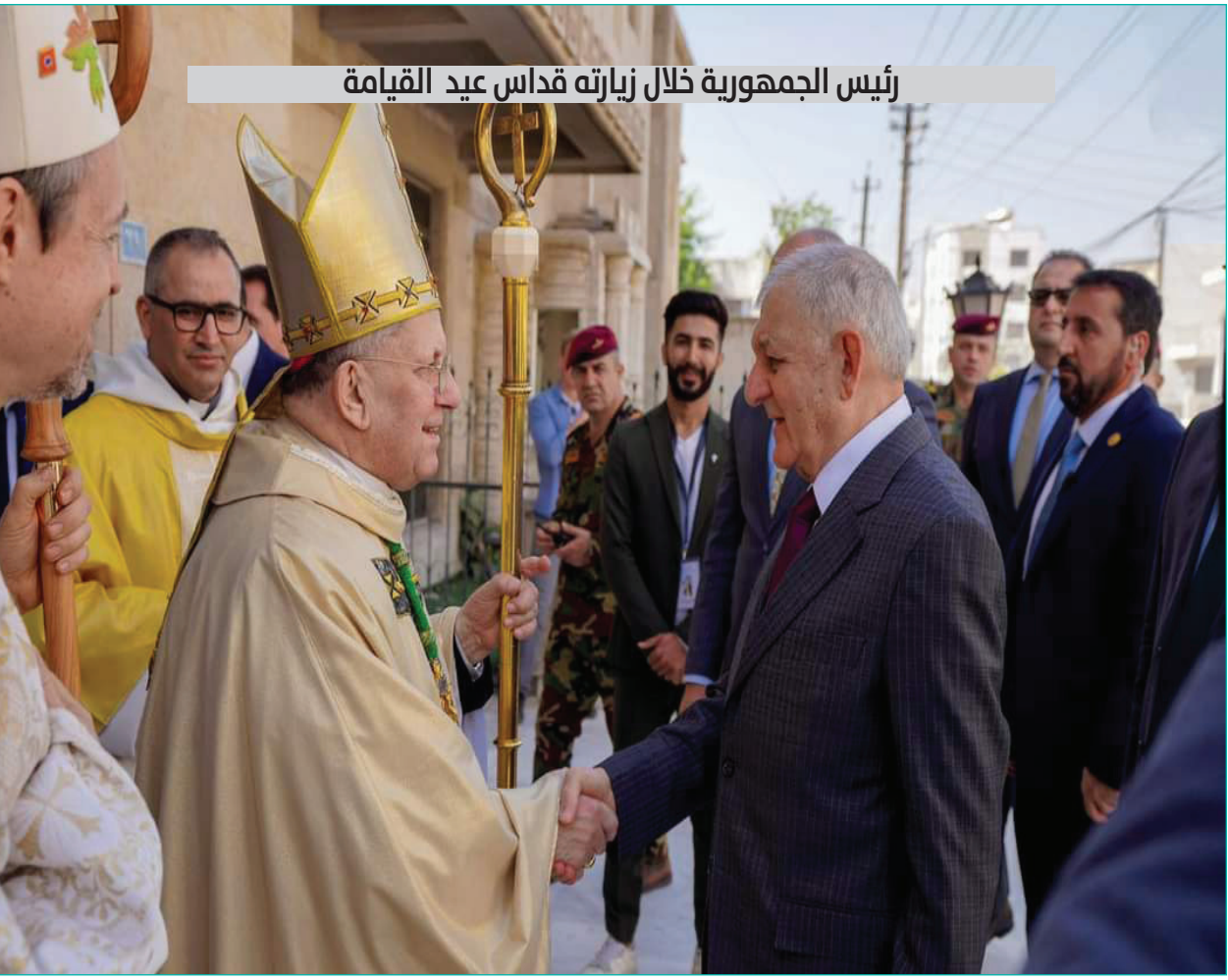
رئيس الجمهورية خلال زيارته قداس عيد القيامة

في قضاء طوزخورماتو». وأكد رئيس الجمهورية، وفقاً للبيان، على «ضرورة ترسيخ الاستقرار في المدينة وضمان أمن أهلها، إلى جانب توفير كافة المستلزمات الخدمية والمعيشية لسكانها، وتلبية مطالبهم واحتياجاتهم»، لافتاً إلى أن «أهالي طوزخورماتو كانت لهم مواقف مشهودة في مقارعة الإرهاب وحماية التعايش السلمي، وعانوا لسنوات عديدة من التحديات والمشاكل التي ينبغي حلها». من جانبهم، قدم أعضاء الوفد لرئيس الجمهورية شرحاً حول الأوضاع في طوزخورماتو وأحوال أهلها، وبعض المشاكل التي تواجههم، فيما أعرب الرئيس عن دعمه لأهالي المدينة وحسم المسائل العالقة.