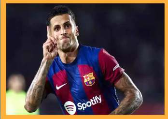
كانسيلو يضي من أجل عيون برشلونة