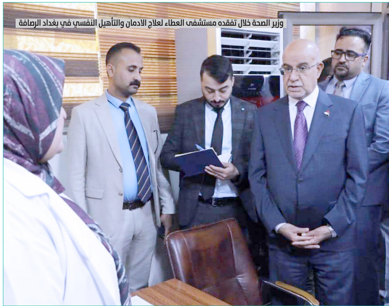
وزير الصحة خلال تفقده مستشفى العطاء لعلاج الامان والتأهيل النفسي في بغداد الرصافة