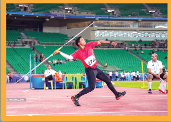
العراق حلّ ثانياً وإيران أولاً وقطر بالمركز الثالث في ختام بطولة غرب آسيا

3 من | المصرف العقاري يضع خطة متابعة آليات التحصيل وجباية مستحقات القروض