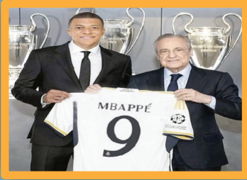
مباي... رسالة مديرد إلى كاتالونيا «الهيمنة قادمة»