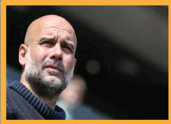
ترقب سعودي... جوارديول يزيد الغموض حول مصير إيدرسون