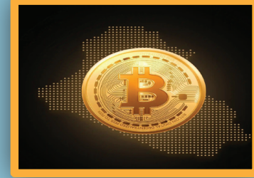
2 من نظرة في مستقبل العملات الإلكترونية في الاقتصاد العالمي وتطبيقاتها المحتملة في العراق