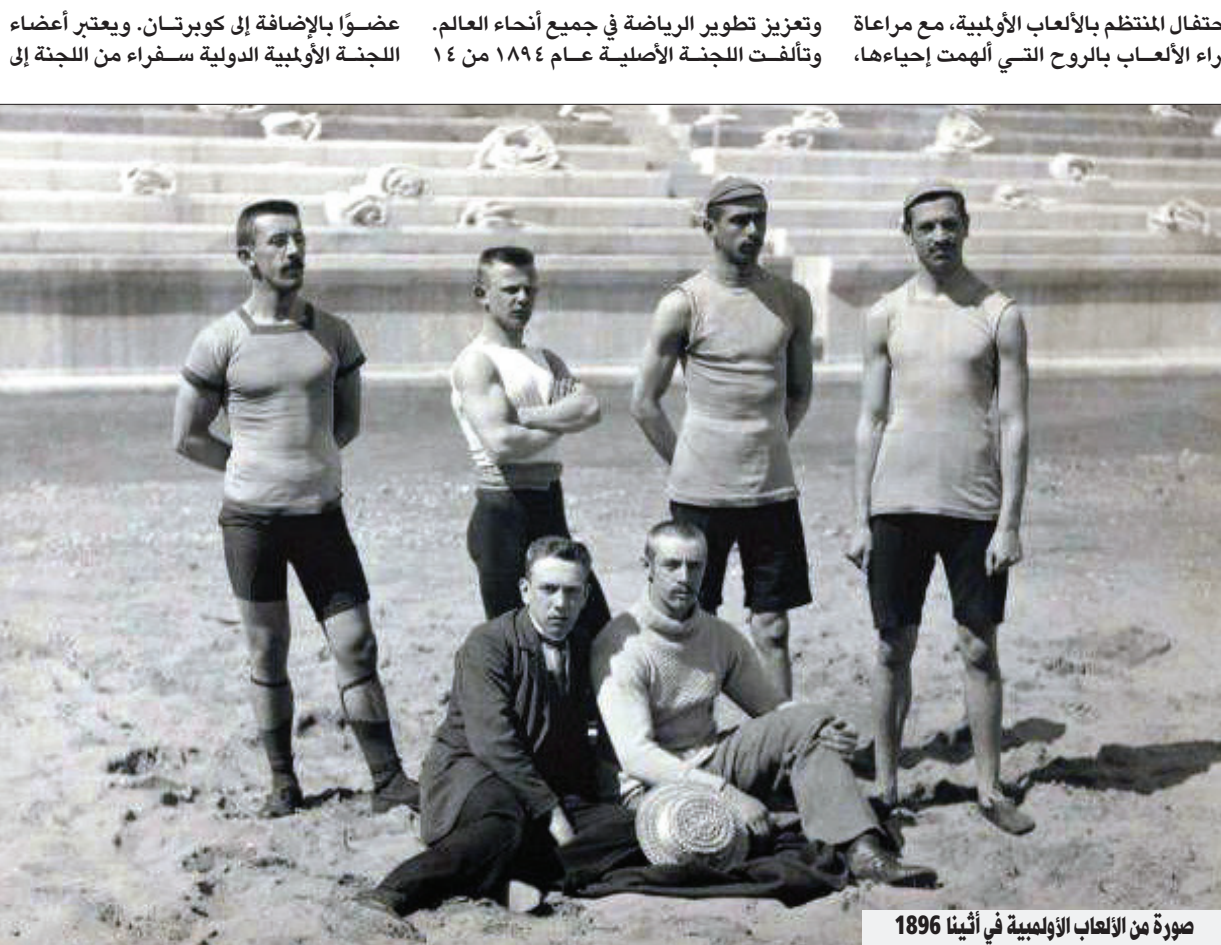
صورة من الألعاب الأولمبية في أثينا 1896

أت أفكار وأعمال العديد من الأشخاص إلى إنشاء الألعاب الأولمبية الحديثة. وكان أشهر مهندس للألعاب الحديثة هو بيري دي كوبرتان، الذي ولد في باريس في يوم رأس السنة الجديدة عام ١٨١٢. وفي سن الرابعة والعشرين قرر كوبرتان أن مستقبله يكمن في التعليم، وخاصة البدني. وفي عام ١٨٩٠ سافر إلى إنجلترا للقاء الدكتور ويليام بيني بروكس الذي كان قد كتب بعض المقالات عن التعليم البدني التي جذبت انتباه الفرنسي. حاول بروكس أيضاً لعقد من الزمن إحياء الألعاب الأولمبية القديمة، مستوحياً الفكرة من سلسلة من الألعاب الأولمبية اليونانية الحديثة التي أقيمت في أثينا بدءاً من عام ١٨٥٩. وتأسست الألعاب الأولمبية اليونانية على يد إيفانجيليس زايباس، الذي حصل بدوره على الفكرة من باناجيوتيس سوتسوس، وهو شاعر يوناني كان أول من دعا إلى النهضة الحديثة وبدأ في الترويج للفكرة في عام ١٨٣٣. وكانت أول أولمبياد بريطانية لبروكس، والتي أقيمت في لندن عام ١٨٦٦، ناجحة، وحضرها العديد من المثقفين والرياضيين. لكن محاولاته لاحقة لاقت نجاحاً أقل وواجهت لامبالاة عامة ومعارضة من المجموعات الرياضية المنافسة. وبدلاً من الاستسلام، بدأ بروكس في ثمانينيات القرن التاسع عشر بالدفاع عن