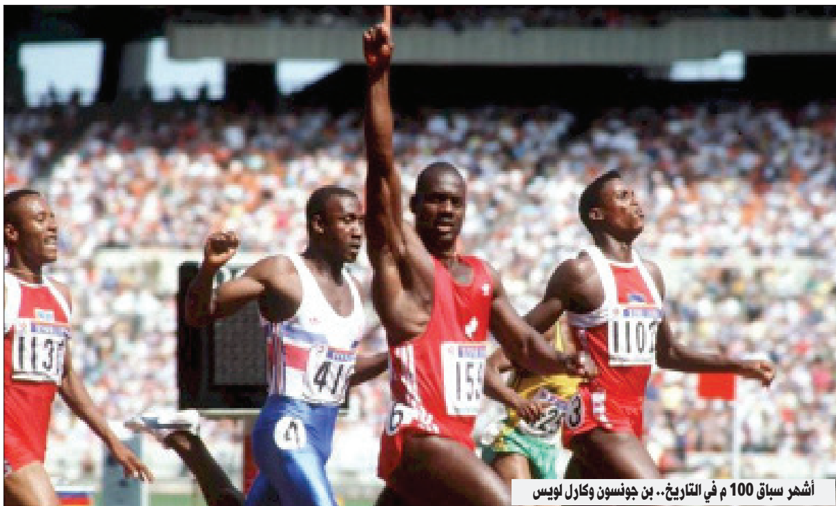
أشهر سباق 100 م في التاريخ.. بن جونسون وكارل لويس