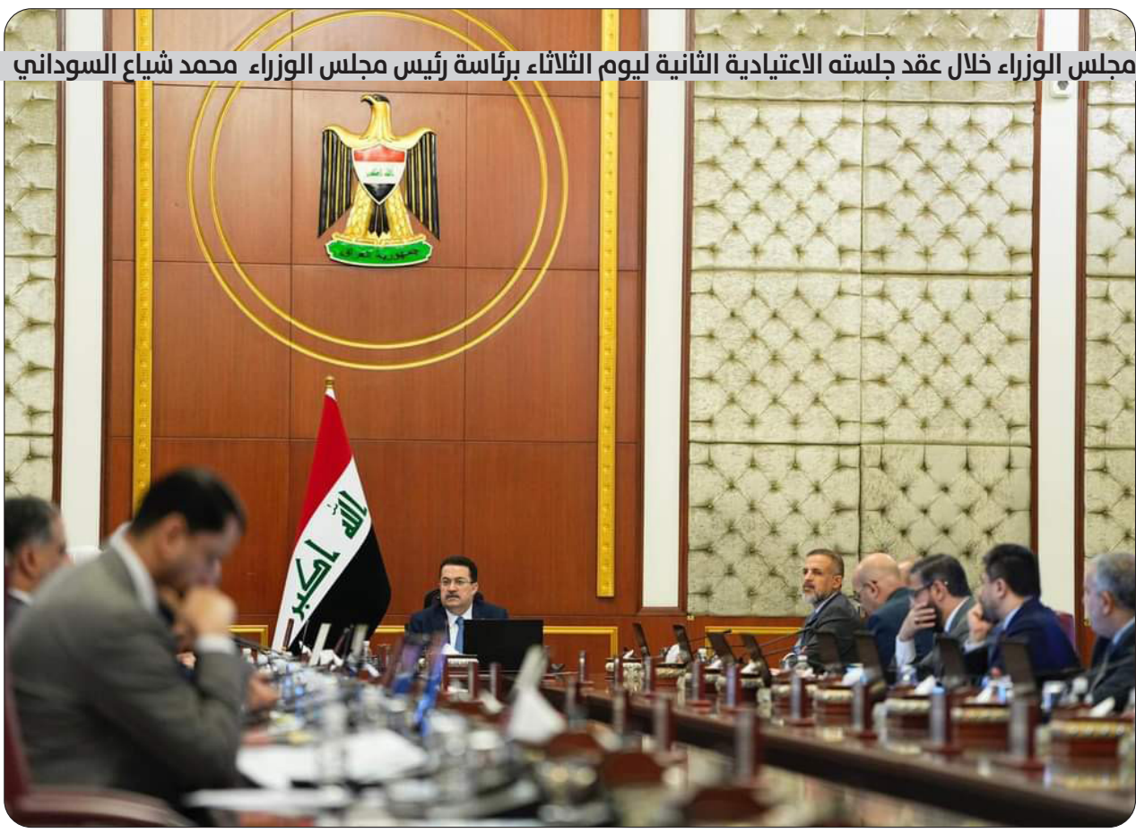
مجلس الوزراء خلال عقد جلسته الاعتيادية الثانية ليوم الثلاثاء برئاسة رئيس مجلس الوزراء محمد شياع السوداني