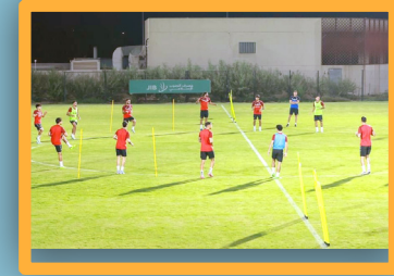
اتحاد الكرة يحث الجماهير لحضور مباراة العراق وفلسطين في البصرة