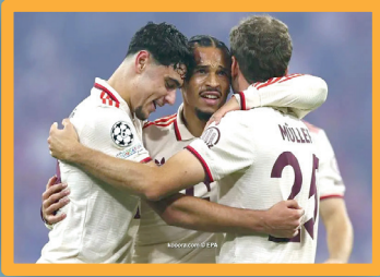
مانشستر يونايتد يطار 3 صفقات من بايرن ميونخ