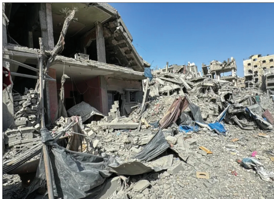
زوارق حربية قصفت شاطئ المخيم. وأكد إصابة فلسطينيين إثر القصف الصهيوني المتواصل على حي الزيتون جنوب شرقي مدينة غزة، وإصابة عدد من الأشخاص إثر إطلاق نار من مسيرة

صهيونية على فلسطينيين في منطقة الصفاوي شمال غربي مدينة غزة. وقالت وسائل إعلام محلية إن عددا من الفلسطينيين أصيب جراء استهداف مسيرة صهيونية مواطنين في جباليا شمالي قطاع غزة. وشددت على استمرار القصف منذ ساعات الصباح الأولى وإطلاق النار من أليات الاحتلال في مخيم جباليا وبيت لاهيا ومحيط التوام والصفاوي شمال القطاع. كذلك أفادت بإطلاق نار من زوارق حربية إسرائيلية في بحر شمال غربي مدينة خان يونس جنوبي قطاع غزة. وأضافت أن قوات الاحتلال أطلقت قذائف مدفعية بشكل مكثف على مناطق متفرقة من حي الزيتون جنوب شرقي مدينة غزة، بالتزامن مع إطلاق النار من ألياته العسكرية على المنازل وسماع انفجارات في المنطقة. وتواصلت قوات الاحتلال منذ الخامس من أكتوبر/ تشرين الأول الجاري، اجتياحها البري وقصفها العنيف لمناطق مختلفة من محافظة شمال غزة بالتزامن مع استمرار مساعيها لإفراغ المنطقة من ساكنيها عبر الإخلاء والتجوير القسري. ومنذ أكثر من عام، تواصلت قوات الاحتلال عدوانها على قطاع غزة، مما أسفر عن استشهاد ٤٢ ألفاً و٩٢٤ وإصابة ١٠٠ ألف و٨٢٣ آخرين، تحت الأنقاض.