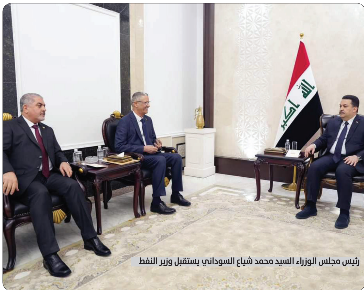
رئيس مجلس الوزراء السيد محمد شياع السوداني يستقبل وزير النفط

بغداد-المواطن يعتزم مجلس النواب، استجواب وزير الدفاع وقادة عسكريين بارزين بعد قضية انتهاك الأجواء العراقية من قبل الطائرات الإسرائيلية. وقال عضو لجنة الأمن والدفاع النيابية مهدي تقسي أمري في حديث لـ السومرية نيوز، إن «الطائرات الإسرائيلية استخدمت أجواء العراق في ضرب دول الجوار وتحاول جر العراق وتحوله إلى ساحة صراع إقليمي لتصفية الحسابات، وهذا أمر مرفوض جملة وتفصيلاً». وأضاف أمري، أن «القائد العام للقوات المسلحة ووزير الدفاع والعمليات المشتركة والدفاع الجوي يجب أن يكون لهم