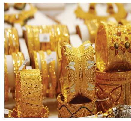
استيراد العراق ذهباً تركيا بقيمة 1,5 مليار دولار خلال عام 2021.

ووفق الإحصاءات الحكومية فإن معدل الاستيراد الشهري بشكل عام للذهب في العراق يصل لنحو 7,5 أطنان ويبلغ الرسم الجمركي الذي يجبي عن كل كيلوغرام منه 250 دولاراً، بمجموع 1 مليون و 875 ألف دولار. ووفق بيانات الموقع «بلومبيرغ» (Bloomberg) المتخصص، فقد اشترى العراق 33,9 طناً من الذهب في العام 2023، في حين كشف القنصل التركي العام في أربيل هاكان كارا جاي عن