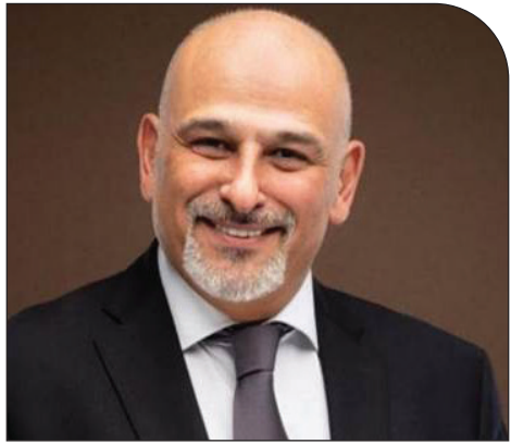
المواطن - متابعة

بعد يومين فقط من إسقاط النظام السوري، أعلن الفنان جمال سليمان نيته الترشح لمنصب رئيس الجمهورية السورية. وصرّح سليمان قائلا: «قبل سنوات عزّبت عن رغبتني هذه في حديث مع (العربية الحدث). عندما سُئلت إن كنت أطمح للترشح لرئاسة سوريا، أجبته بنعم، لدي هذه الرغبة». وأضاف: «لكل هذا لا يعني أنه أمر حتمي، بل يعتمد على عدم وجود مرشح آخر أراه أكثر كفاءة مني، سواء كان رجلاً أو امرأة. سأقدم نفسي كمرشح فقط إذا شعر السوريون بأنني الشخص المناسب».