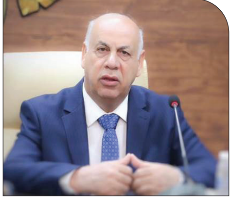
المواطن - متابعة

أكد وزير الثقافة والسياحة والآثار الدكتور أحمد فكاك البرداني، الثلاثاء، أن تنويع بغداد عاصمة للسياحة العربية سيخلق فرصة استثمارية كبيرة، فيما بين أن هذا التنويع سيزيد فرص العمل في الأسواق الشعبية والمهن. وقال البرداني لوكالة الأنباء العراقية (واع): «تم إدراج ١٨ بنداً على جدول أعمال المجلس التنفيذي لوزارة السياحة العربية وأبرز هذه البنود اختيار عاصمة للسياحة العربية»، مشيراً إلى أن «دعم رئيس الوزراء محمد شياع السوداني والجهود المبذولة في بغداد من قبل الجميع توج بتصويت المجلس بالإجماع على أن تكون بغداد الجميلة والحبيبة عاصمة للسياحة العربية لعام ٢٠٢٥».