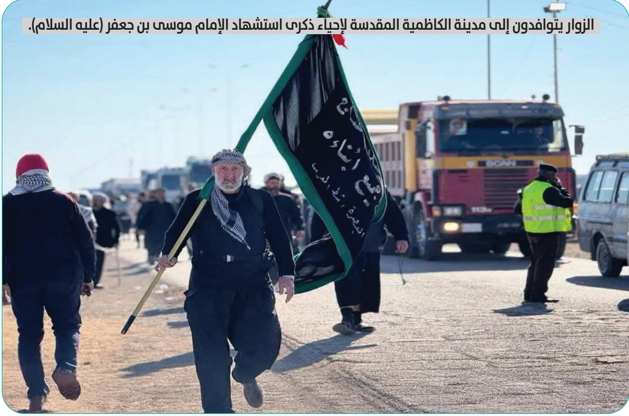
الزوار يتوافدون إلى مدينة الكاظمية المقدسة لإحياء ذكرى استشهاد الإمام موسى بن جعفر (عليه السلام).