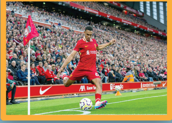
ريال مدريد يحسم صفقة أرنولد