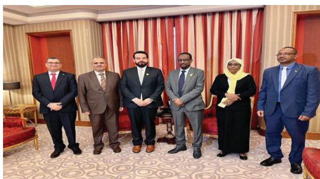
بغداد - المواطن

بحث مدير عام دار المخطوطات العراقية في وزارة الثقافة أحمد كريم العلياي مع خالد علي الأعيسر وزير الثقافة والإعلام في جمهورية السودان العلاقات التاريخية وتبادل الخبرات في مجال الاختصاص بين البلدين .