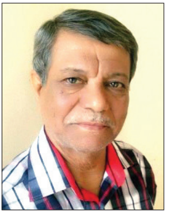
شعر: حامد عبد الصمد البصري

١- التمثال ماذا أفعل لو كان التمثال يتحدث عن سيرة صاحبه أقول لكم ماذا قال .....؟ ٢- وجم مآزلات جيكيور تتذكر صورته الأولى كان البدر .. بدشاشته البيضاء يمشي بين (يوبوب) وبين البيت مثل حكاية حب عن حزن... مسرور يمشي ويدور... يدور يتعثر في خطوته فيمد يدا يتحسس بعض الآلام ويصيح بأعلى صوت: