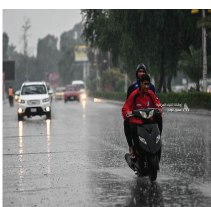
بغداد - المواطن

أمطار متوسطة الشدة وفيها تكون غزيرة في الأقسام الشرقية من المنطقة الشمالية، وفي المنطقة الجنوبية فيسكون الطقس فيها غائماً جزئياً، درجات الحرارة تنخفض قليلاً، مدى الرؤية (١٠-٨) كم وفي المطر (٦-٤) كم».