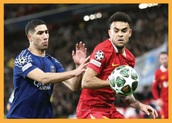
7من برشلونة يجري محادثات مع نجم ليفربول

3من شواني يوجه بإعفاء ذوي الشهداء من أجور الخدمات العدلية