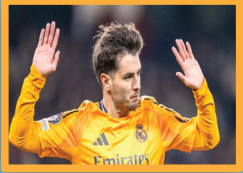
ريال مدريد يفتح الباب أمام رحيل إبراهيم دياز