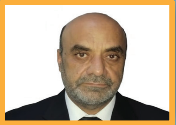
هلاك الازم هو(القباهي بالتواء في المجتمعات الفقيرة)