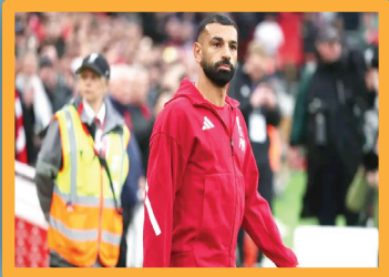
محمد صلاح: فكرت بالفعل في ترك أوروبا والعودة لأهلي أو الزمالك