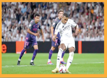
ركلات الجزء تضع مبابي على عرش أوروبا