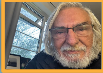
2ص المدينة والدولة وقانون الجنسية والتأميمات والبنى الأولية للقرابة

3ص عمليات بغداد : إغلاق 201 كورة صهر و72 معمل طابوق وأسفلت للحد من التلوث