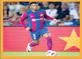
بالدي: عملنا الدفاعي أمام أتلتيكو مدريد يستحق الإشادة