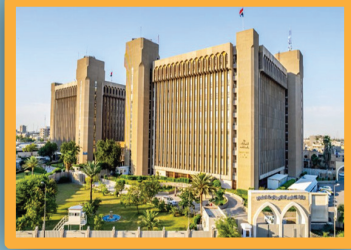
التعليم في العراق ... من النظريات إلى التطبيق

عاصفة ماطرة واسعة تضرب العراق وتحذيرات من سيول ورياح قوية