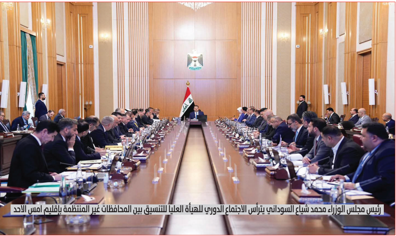
رئيس مجلس الوزراء محمد شياع السوداني يترأس الاجتماع الدوري للهيئة العليا للتنسيق بين المحافظات غير المنتظمة بإقليم امس الاحد

معطيات قانونية وإدارية». وأضاف المصدر أن «من بين الأسباب التي استندت إليها اللجنة في قرارها، ما يتعلق بملف الخدمة العسكرية الجبوري، واعتبار خدمته مشمولة بإجراءات المساءلة والعدالة، فضلاً عن عدم انطباق بعض متطلبات شرط حسن السيرة والسلوك وفق التعليمات النافذة..