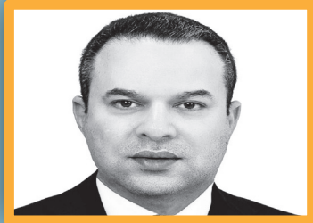
ييلدونغ: تكوين الإنسان قبل تكوين الدولة

3ص العراق ينجح بادراج ملف «اسطوانة كورش» ضمن لائحة التراث العالمي