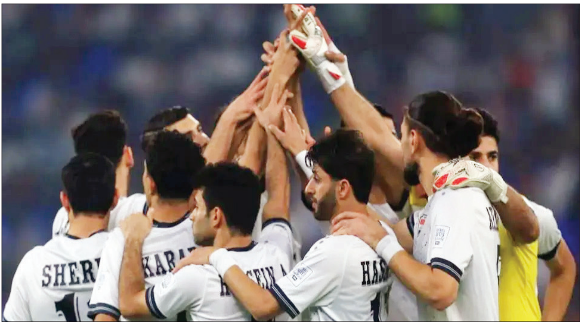
المواطن - متابعة