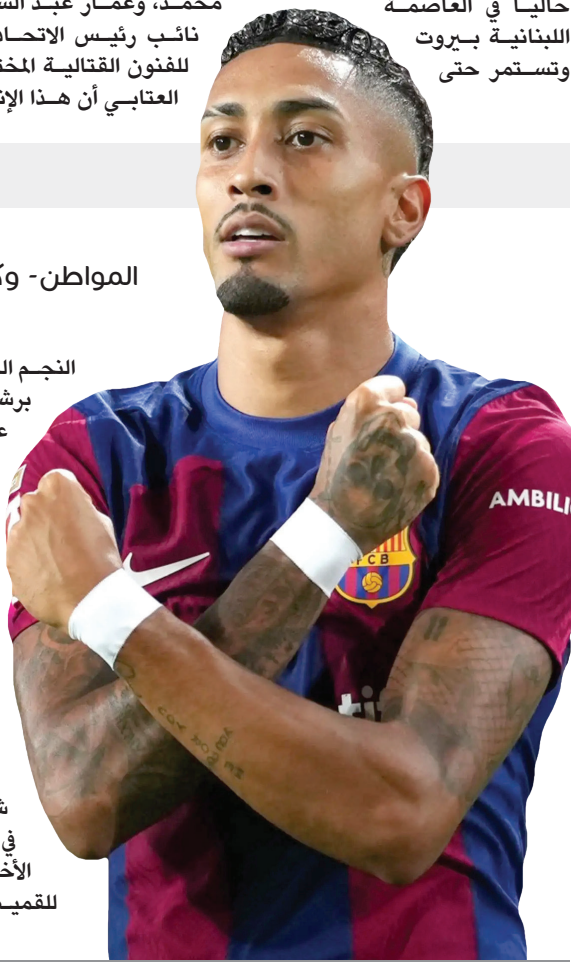
المواطن - وكالات

أحرز المنتخب العراقي للفنون القتالية المختلطة (MMA) ذهبية بطولة آسيا للشباب والمتقدمين، المقامة حالياً في العاصمة اللبنانية بيروت وتستمر حتى