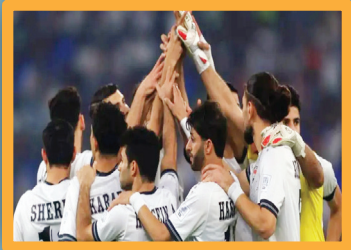
سيناريوهات حاسمة للعراق قبل مواجهة الجزائر