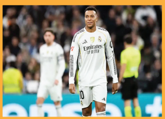
مبابي يلعب برقم استثنائي وسط ظلم ريال مدريد