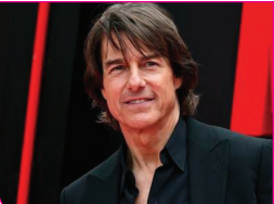
كوميديا كارتية.. توم كروز يطرح البرومو الأول لفيلمه الجديد (ديجر)