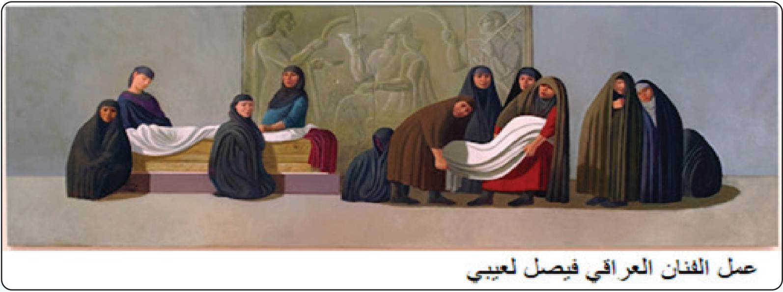
عمل الفنان العراقي فيصل لعبي