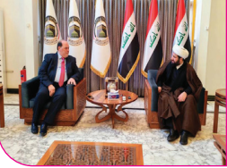
نقيب الفنانين العراقيين يلتقي رئيس هيئة الحج والعبادة

وفي الجزائر عالجت بعض التجارب المسرحية آثار (العشرية السوداء)، أو الإرهاب العابر للحدود، من خلال التركيز على الضحية، وعلى تمزق المجتمع بين الخوف والرغبة في الحياة. في أغلب هذه التجارب المسرحية لم يواجه الإرهاب وحده، بل سعى إلى تحويل المتلقي إلى شريك في المقاومة، فالعروض المسرحي، بخلاف الخطاب الإعلامي السريع، يخلق زمناً لتأمل، ومساحة للشك، وإمكانية للتعاطف الإنساني، وهي عناصر تقوّض منطق الكراهية، فحين يرى المتلقي نفسه على الخشبة في خوفه، وتردده، وتناقضه يصبح أقلّ قابلية للانجرار وراء خطاب الإلقاء. وهنا تكمن قوة المسرح الناعمة، التي قد تبدو ضعيفة أمام السلاح، لكنها عميقة الأثر على المدى الطويل.