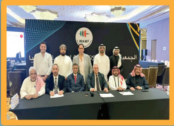
العراق رئيساً لاتحاد عرب آسيا لرفع الإنثال