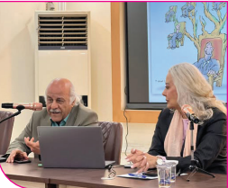
محاضرة للمحميري عن الإبداع التعبيري في فن الكاريكاتير في كلية المنصور

التقى نقيب الفنانين العراقيين الدكتور جبار جودي مدير عام دائرة السينما والمسرح ظهر هذا اليوم رئيس الهيئة العليا للحج والعمرة الشيخ سامي المسعودي وبحث معه تسهيل ودعم الفنانين العراقيين في ملفي العمرة والحج. كما ناقش الجانبان الخطوات المشتركة لتحوليل الانجازات والنجاحات التي حققتها الهيئة الى نتاجات فنية ترفع اسم العراق بين بقية البلدان العربية والإسلامية. وجرى خلال اللقاء الاتفاق على مبادرة إنسانية وثقافية كبيرة تتكفل بموجهها هيئة الحج والعمرة برعاية الفنانين العراقيين تقديرًا لدورهم الريادي في بناء الوعي والجمال والحفاظ على الهوية الوطنية. وأكد الدكتور جبار جودي أن هذه المبادرة تمثل خطوة مباركة لدعم شريحة الفنانين مشيداً بالجهود الكبيرة التي تبذلها هيئة الحج والعمرة وحرصها على احتضان الطاقات الإبداعية العراقية. من جانبه ثخن نقيب الفنانين هذه الاتفاقات الريمة موجهاً شكره وتقديره لرئيس هيئة الحج والعمرة على هذه المبادرة المباركة التي تعكس روح التكافل والدعم الحقيقي للفن والثقافة في العراق.