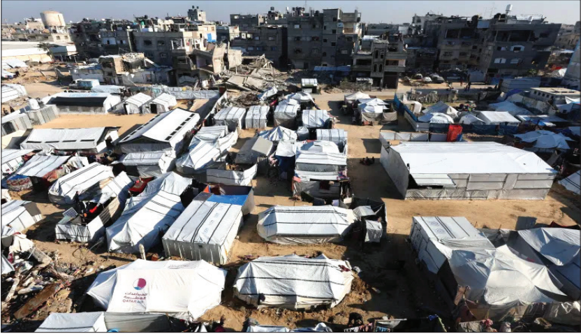
المواطن - وكالات

إلى وجود ضحايا داخل الخط الأصفر بفعل قصف قوات الاحتلال، وإلى عدم تمكن الأطقم الطبية من التدخل لإجلانهم بسبب استمرار إطلاق النار، واستهداف كل من يتحرك في المنطقة. وأفاد مصدر في مستشفى المعمداني في قطاع غزة، أمس الاثنين، باستشهاد شابين فلسطينيين بتران جيش الاحتلال داخل مناطق الخط الأصفر في حي الشجاعية شرقي مدينة غزة، في حين قال مراسل الجزيرة إن الطواقم الطبية تمكنت من انتشال الشهيدين ونقلهما إلى المستشفى المعمداني. تأتي هذه التطورات وسط خشية حقيقية بين سكان القطاع من قيام الاحتلال بتهجيرهم شرق الخط الأصفر. وتبدو ملامح الخوف من هذا المصير لدى الغزيين في تفاصيل حياتهم اليومية، إذ لا تجد أم أحمد قديح في بلدة بني سهيلا بجنوبي