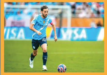
برشلونة يراقب صفقة مجانية من مانشستر سيتي