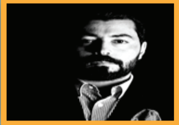
سجن الشدادى: شرارة محتملة لمخيم المول وتهديد العراق القادم