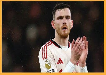
قرار نهائي من ليوفربول بشأن انتقال روبرتسون إلى توتنهام