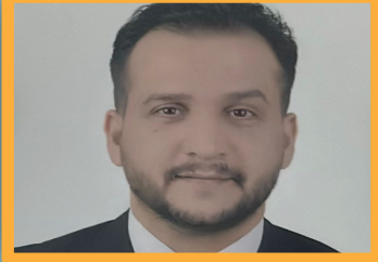
هل يحمي القانون الدولي الإنساني نفسه؟

3 ص أكثر من 50 ألف مولدة ديزل تحول مدن العراق إلى بؤر «مسرطنة»